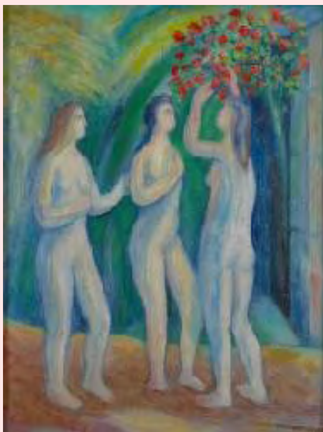
Manuel Colmeiro Las tres gracias, 1963

S. Howell, que analitza - i defensa - aquesta lògica de substitució, reprèn la imatge de l'empelt, del transplantament. Aquesta familiarització del nen que ella anomena "kinning" es prepara des del projecte parental, després es prolonga en el període d'espera per concretar-se amb l'arribada del nen; aquests dos períodes que precedeixen l'arribada del nen adoptat són semblants a aquella que precedeixen el naixement d'un nen. Aquesta assimilació entre el nen adoptat i el nen nascut dels seus pares s'assemblaria al fenomen de la transsubstanciació: « La transsubstanciació permet, en el cas de l'Eucaristia, que el pa i el vi es transsubstancïïn en el cos i la sang de Crist com a resultat de la qual cosa "només les aparicions (i altres "accidents") dels mateixos es mantenen. De la mateixa manera, en els nens i nenes adoptats transnacionalment, la criança no transforma en la seva aparença, sinó només el seu ser o essència, es a dir, no produeix la seva completa transformació. Com va senyalar una jove dona sueca adoptada a la India "sóc una nena coco, marró per fora i blanca per dins" accepta també D. Marre, citant Howell (2006 : 69). Nosaltres podem preguntar si aquesta aproximació entre transsubstanciació i adopció no donaria a aquesta darrera idea una aura de sagrat.