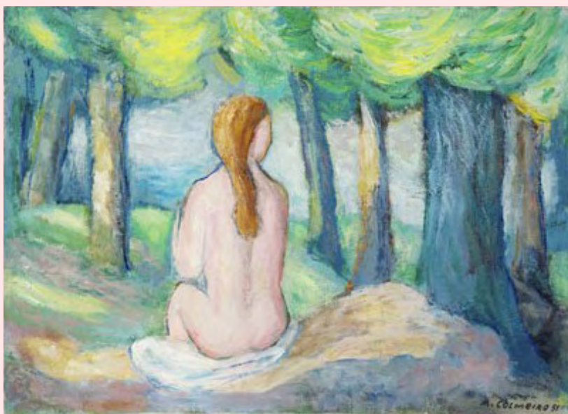
Manuel Colmeiro Desnudo de mujer, 1951

L'adoptat es torna a trobar entre dos universos de parentalitat, l'un, la parentalitat adoptiva, oficial; l'altre, la parentalitat de naixement, esborrada. No obstant això, la ruptura institucional entre aquests dos universos no és mai completa, ja que els "desnuament i renuament" de filiació deixen traces d'un lligam. En efecte, si ens fixem en els impediments de matrimoni a partir de les prohibicions d'incest, constatem, d'acord amb C. Collard (2011), que, d'una banda, els impediments de contraure matrimoni per una proximitat massa gran continuen jugant dins la parentalitat d'origen; i que, d'altra banda, els impediments de matrimoni que s'estableixen dins la parentalitat adoptiva son menys consrenyedors entre l'adoptat i la seva família adoptiva que si ell fos el fill biològic d'aquesta família adoptiva.