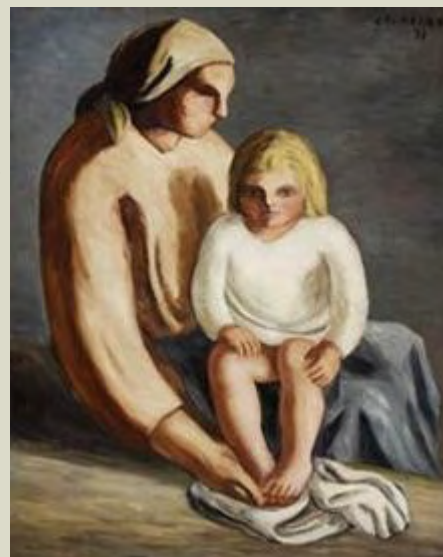
Manuel Colmeiro Mujer con niño, 1939

Un antropòleg britànic, J. Pitt-Rivers, format en estudis clàssics del parentiu, que ha treballat molt sobre la filiació i l'aliança dins de les societats mediterrànies (el seu primer estudi va ser en un poble a prop de Ronda, a Andalusia) va escriure el 1973 que un matrimoni sense descendència havia quedat en l'oblit, perquè que sense efectes, la unió de les línies de cada un dels cònjuges no va ser recordada per cap fill. Aquest darrer representava, per la seva pròpia existència, aquesta aliança. Avui, amb les transformacions de maneres d'entrar en família, es tracta de reconèixer ara i sempre aquest "valor del lligam" donat al nen, no solament en relació amb els llinatges matern i patern, sinó respecte a tots els personatges que han ajudat a la seva existència.