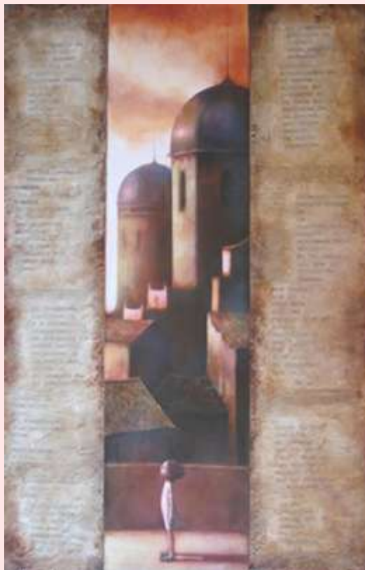
Preguntas al aire

El miedo a que, finalmente, la sangre tire... y triunfe.