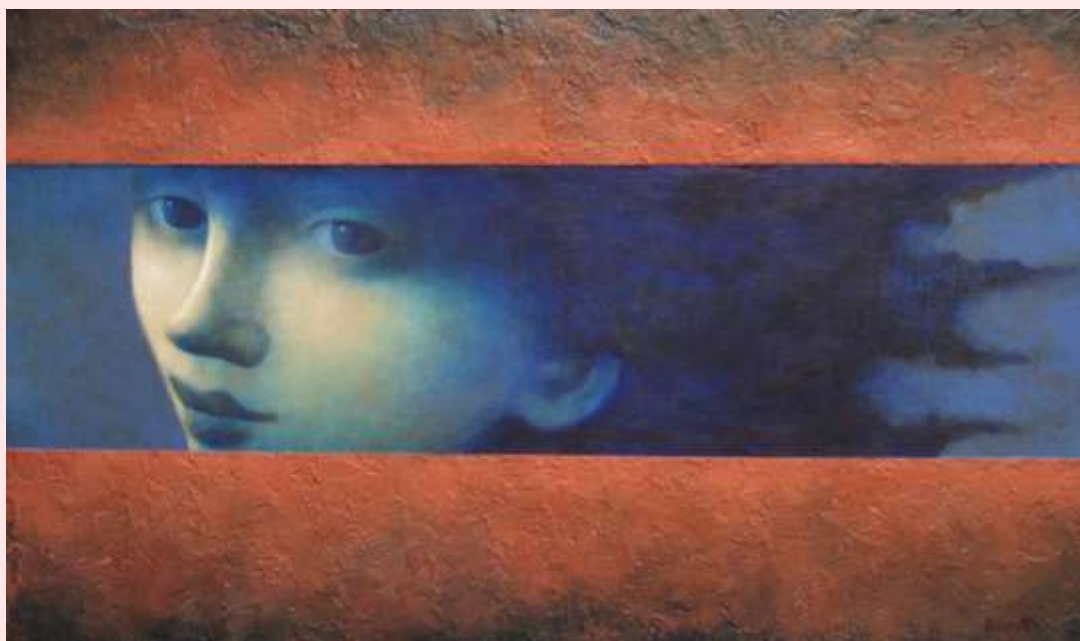
El viaje secreto de las miradas