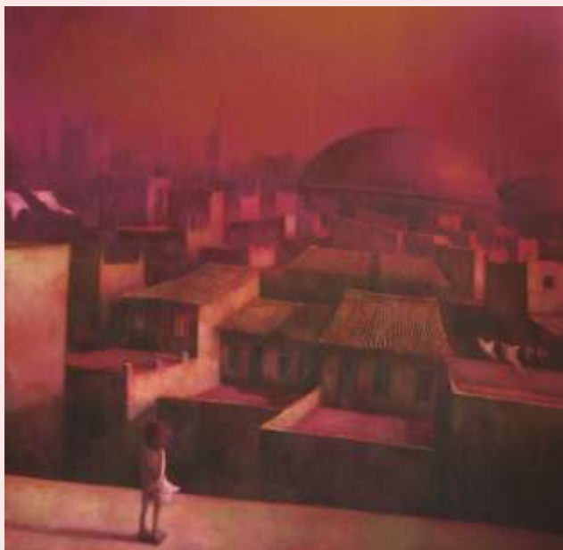
Sobre el vientre rojo de la ciudad