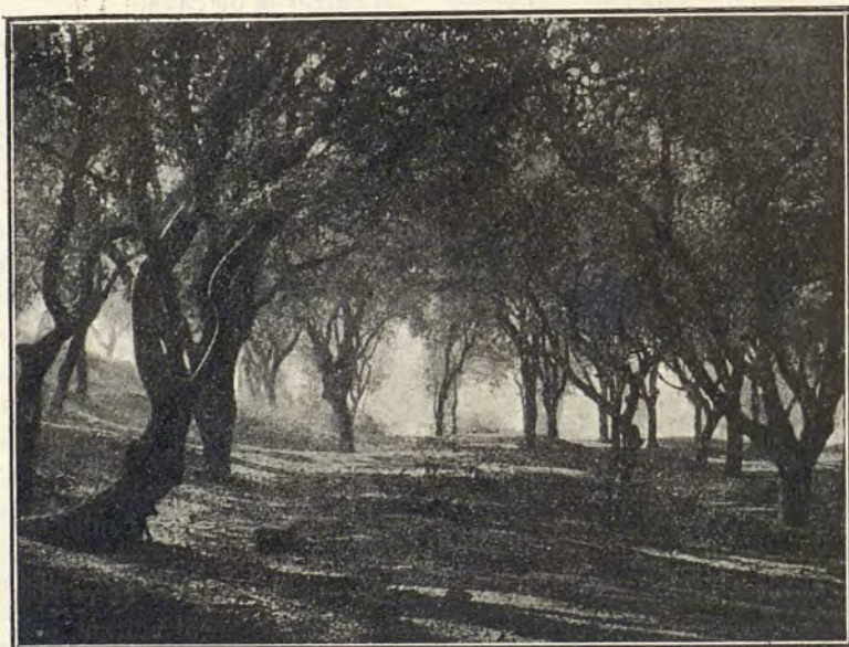
Bosc de les Alsines de Torre del Baró