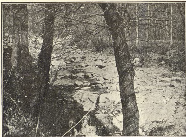
El Riu Fresser - Ribas