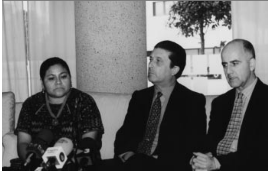
Rigoberta Menchú, Federico Mayor Zaragoza i Álvaro de Soto, en la Trobada sobre Gestió i Conflictes a Amèrica Llatina.

El director general de la UNESCO, Federico Mayor Zaragoza, va tancar la Trobada sobre Conflictes i Experiències d'Intermediació a Amèrica Llatina. Reptes per al Segle XXI , que va tenir lloc a la UAB, del 27 al 29 de maig, fent una crida a favor de la cultura de la pau. Contra la cultura de la violència, Mayor Zaragoza va demanar el concurs de tothom per assolir una cultura de pau. Per aquest motiu, cal buscar tractaments als conflictes «abans que el diagnòstic sigui definitiu», va dir davant de les persones que omplien a vessar l'Auditori de la Facultat de Filosofia i Lletres en un ambient d'empatia col·lectiva.