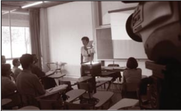
Curs pràctic de docència a l'aula.

El Curs Pràctic de Docència a l'Aula és impulsat pel Vicerectorat d'Ordenació Acadèmica i de Qualitat Universitària, per l'Institut de Ciències de l'Educació (ICE), pel Programa de Suport a la Innovació de la Docència Universitària (PSIDU), i hi col·laboren la Facultat de Ciències i la Facultat de Veterinària de la UAB.