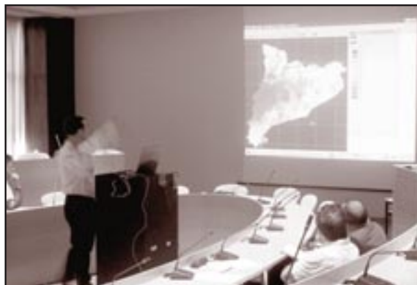
Presentació de l'Atles Climàtic Digital de Catalunya.

tor), permet visualitzar els mapes a través d'Internet. També cal destacar que aquesta eina, desenvolupada per l'equip del professor de