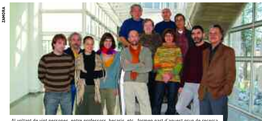
Al voltant de vint persones, entre professors, becaris, etc., formen part d'aquest grup de recerca.