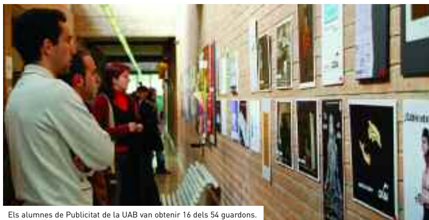
Els alumnes de Publicitat de la UAB van obtenir 16 dels 54 guardons.

La UAB, que va acollir per primer cop el certamen coincidint amb el 80è aniversari de l'Associació Empresarial Catalana de Publicitat, no només va fer de seu dels premis sinó que va voler fer dels Drac un festival fet per estudiants i no només «per a estudiants». Més de setanta estudiants de cinc llicenciatures diferents van treballar en diferents aspectes de l'organització: estudiants de publicitat –coordinats per l'Associació Catalana d'Estudiants de Publicitat (Puarkhé)–, de periodisme, de comunicació audiovisual, de documentació i de traducció i interpretació.