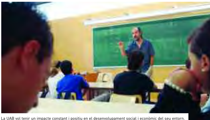
La UAB vol tenir un impacte constant i positiu en el desenvolupament social i econòmic del seu entorn.

Socials i Comunitàries que l'Institut de Govern i Polítiques Públiques ubicarà al districte de Nou Barris, s'iniciaran el curs 2005-2006.