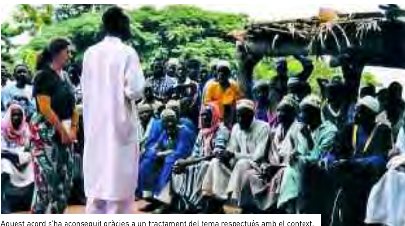
Aquest acord s'ha aconseguit gràcies a un tractament del tema respectuós amb el context.

resposta a l'agressivitat amb què alguns sectors lluitaven contra aquesta qüestió, imposant la seva posició i culpabilitzant les persones que duen a terme aquesta pràctica sense tenir en compte les raons i el context en què es produeixen.