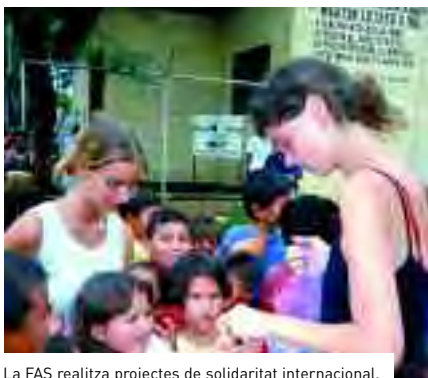
La FAS realitza projectes de solidaritat internacional.