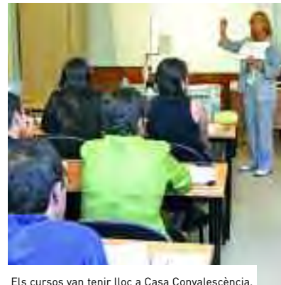
Els cursos van tenir lloc a Casa Convalescència.

D'altra banda, també el mes de juliol, a Casa Convalescència, el Departament de Filologia Espanyola de la UAB va organitzar, per segon any, un curs de formació de professors en què els participants, majoritàriament professors d'ensenyament secundari i mestres de tot l'Estat, van rebre una formació específica i orientada a les diverses necessitats formatives dels ciutadans immigrants.