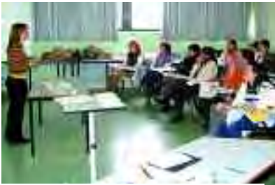
La iniciativa inclou seminaris formatius per al PAS.

Dins del marc del Pla d'Acció de l'Agenda 21, l'Autònoma duu a terme el projecte Compra Verda a la UAB. Aquesta iniciativa té la intenció de facilitar la implantació a la comunitat universitària d'uns criteris de compra i de contractació de serveis que siguin respectuosos amb l'entorn.