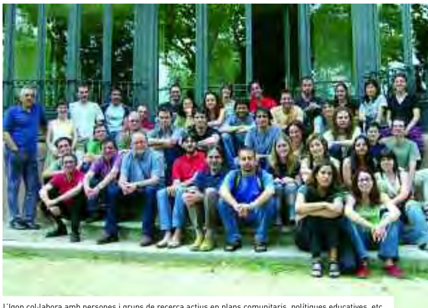
L'Igop col·labora amb persones i grups de recerca actius en plans comunitaris, polítiques educatives, etc.

Segons els seus responsables, l'estratègia de recerca de l'Igop té com a objectiu el manteniment del màxim equilibri possible entre la recerca bàsica i la recerca aplicada, atès que la primera els permet ampliar i consolidar la presència que té l'Igop en les xarxes acadèmiques de recerca, com també avançar en els aspectes de caire més teòric i estratègic, mentre que la segona els permet mantenir la vinculació de l'Igop a la realitat social i institucional que l'envolta i amb la qual se senten compromesos.