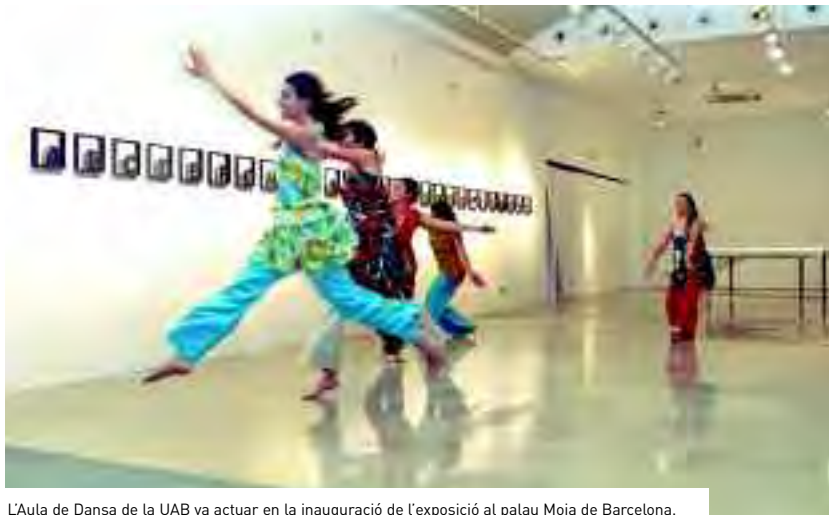
L'Aula de Dansa de la UAB va actuar en la inauguració de l'exposició al palau Moja de Barcelona.