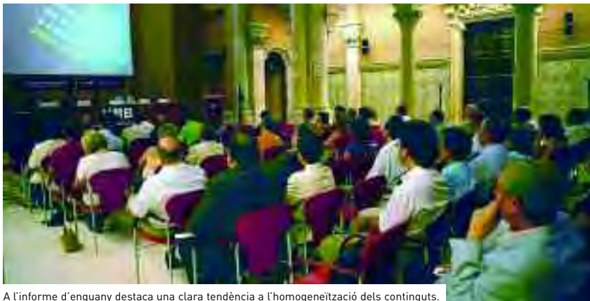
A l'informe d'enguany destaca una clara tendència a l'homogeneïtzació dels continguts.