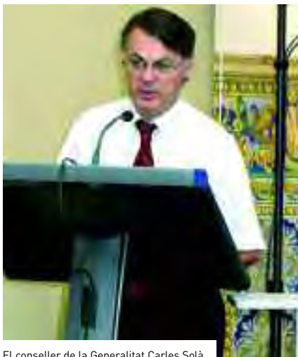
El conseller de la Generalitat Carles Solà.