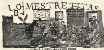
Lo Mestre Titas. Aquest 'Garbuix' conté una pila de composicions metrificades, d'un to festiu popular, i absolutament sense cap mena de pretensions, amb més barrilisme que humorisme.

ESMOYANY... Aquest 'Garbuix' conté una pila de composicions metrificades, d'un to festiu popular, i absolutament sense cap mena de pretensions, amb més barrilisme que humorisme.