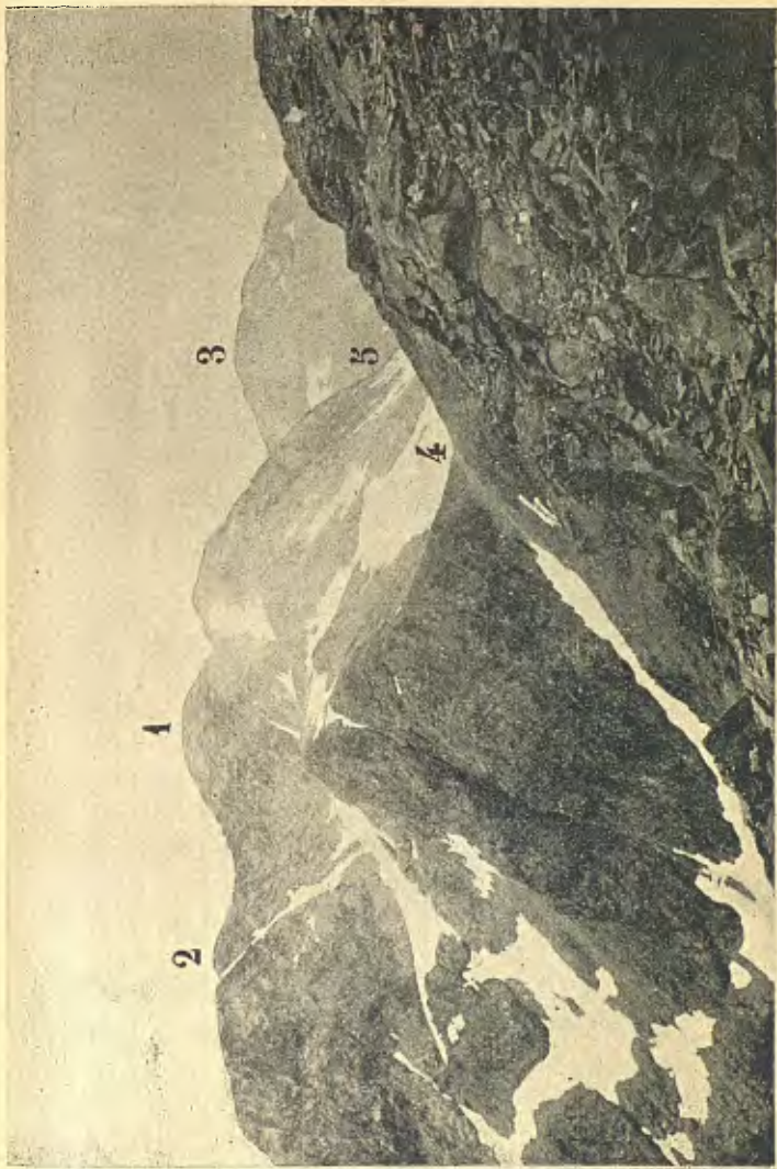
1. La Pica d'Estats (3.141 metres) vista desde'l cim del Montcalm (3.080 m.). — 2. Pich baix dels Estats (3.113 m.). 3. Pich de Sollo (2.953 m.). — 4. Coll de la Coma de Riufrè (2.990 m.). — 5. Port d'Estats ó de Sollo (2.890 m.).