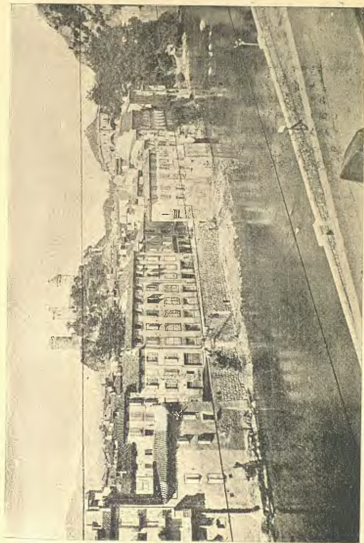
Foix. — Vista presa desde la vora dreta del Ariège.