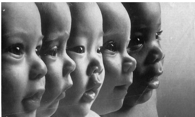
Figura 2. Niños de diversos países

Para acabar, creemos que resulta muy oportuno innovar en este ámbito en un momento en que la inmigración es un hecho estructural en nuestro país, que contribuye a una mayor diversidad humana y, como consecuencia, a una diversidad cultural que se manifiesta en la convivencia de distintos conceptos de salud y enfermedad (figura 2).