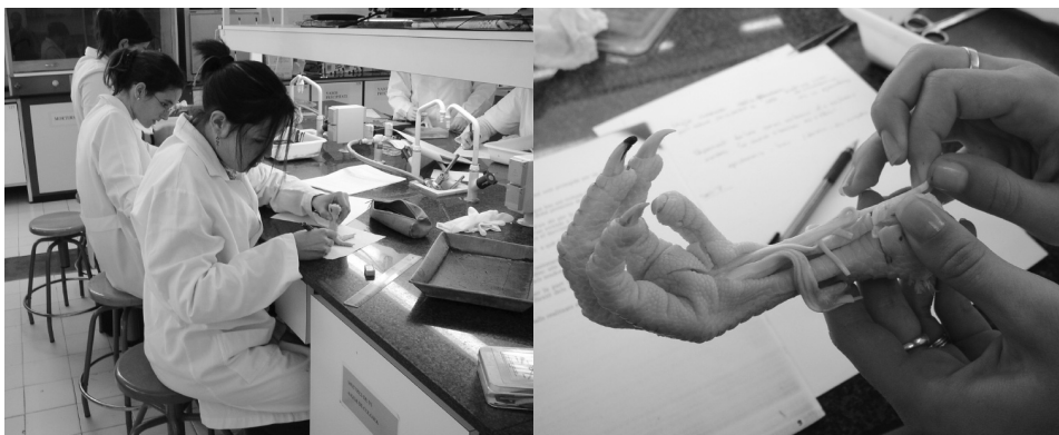
Figura 1. Práctica de una disección en el laboratorio de la Facultad de Ciencias de la Educación de la UAB

Cada estudiante ha realizado una memoria-informe de las prácticas llevadas a cabo en el laboratorio, lo que ha permitido tener una primera colección de CD de las prácticas de laboratorio del curso 2005-2006 y del curso 2006-2007.