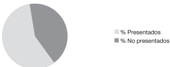
Gráfico 4. Datos del curso académico 2005-2006, comparación del porcentaje de presentados y no presentados