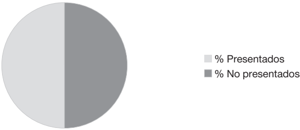
Gráfico 5. Datos del curso académico 2006-2007, comparación del porcentaje de presentados y no presentados

El cuadro 1 contiene los resultados obtenidos en cada curso: