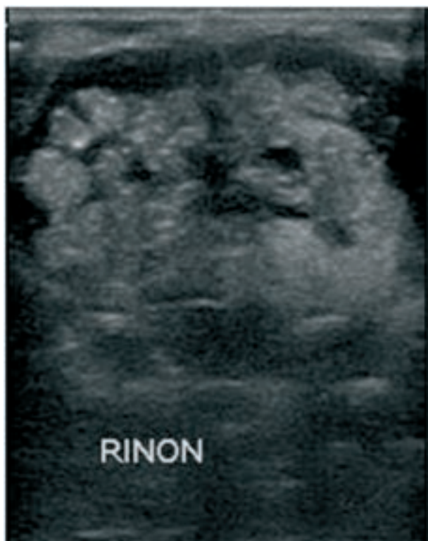
Figura 2. Ecografía de riñón mostrando dilatación de lóbulos renales.

la motilidad gástrica. Los propietarios comentaron que el animal se picaba mucho menos, comía más y estaba más activo; el aspecto de las heces se había normalizado. En la exploración se comprobó que había recuperado peso. La PAS en la anestesia se mantuvo en 106-140 mmHg. Las radiografías revelaron dilatación y acúmulo de gas especialmente en ventrículo. En la ecografía se detectó hipomotilidad de proventrículo y dilatación de uréteres y lóbulos renales (Fig. 2); la contractibilidad cardíaca y la imagen hepática eran normales. La analítica sanguínea reveló