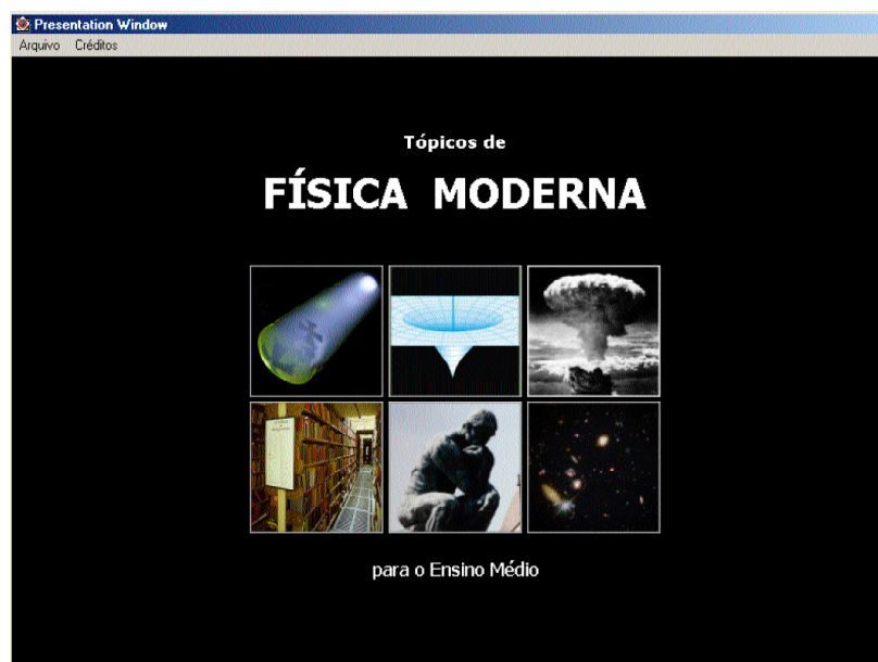
FIGURA 1 Tela de abertura do software , estruturado em seis módulos.

Os conceitos incluídos no software proposto foram selecionados tendo enquanto referência a lista consensual com 18 tópicos de Física Moderna para o Ensino Médio elaborada por Ostermann e Moreira (2000), a partir de um estudo Delphi que envolveu a opinião de físicos, pesquisadores em ensino de Física e professores de Física do Ensino Médio. Visando contribuir para a compreensão quanto à natureza da Ciência e a visão da Física enquanto cultura, também foram acrescentados tópicos considerando-se as inter-relações entre Ciência, Tecnologia, Sociedade e Ambiente; a História da Ciência; e a Filosofia da Ciência.