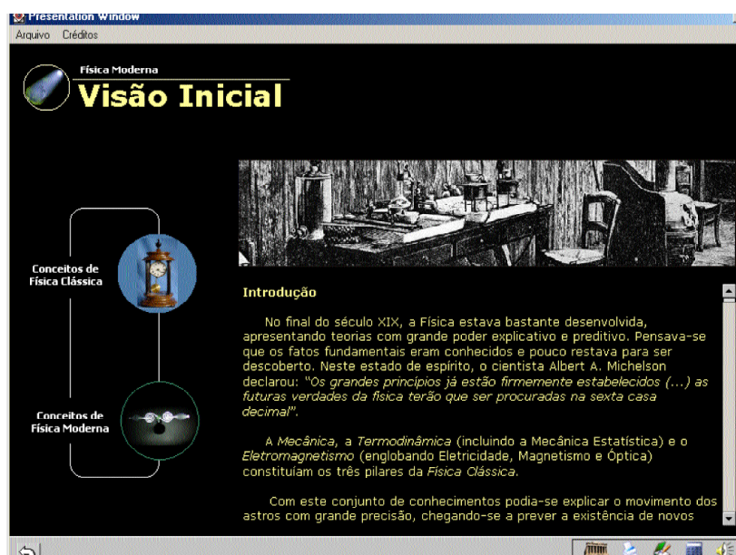
FIGURA 2 Tela introdutória do módulo Visão Inicial, mostrando os links de acesso a dois textos.

Problematização: Solicitar aos estudantes que mencionem aparelhos surgidos recentemente e procurem identificar qual a tecnologia a estes associada, seus impactos sociais e possível relação com a Física.