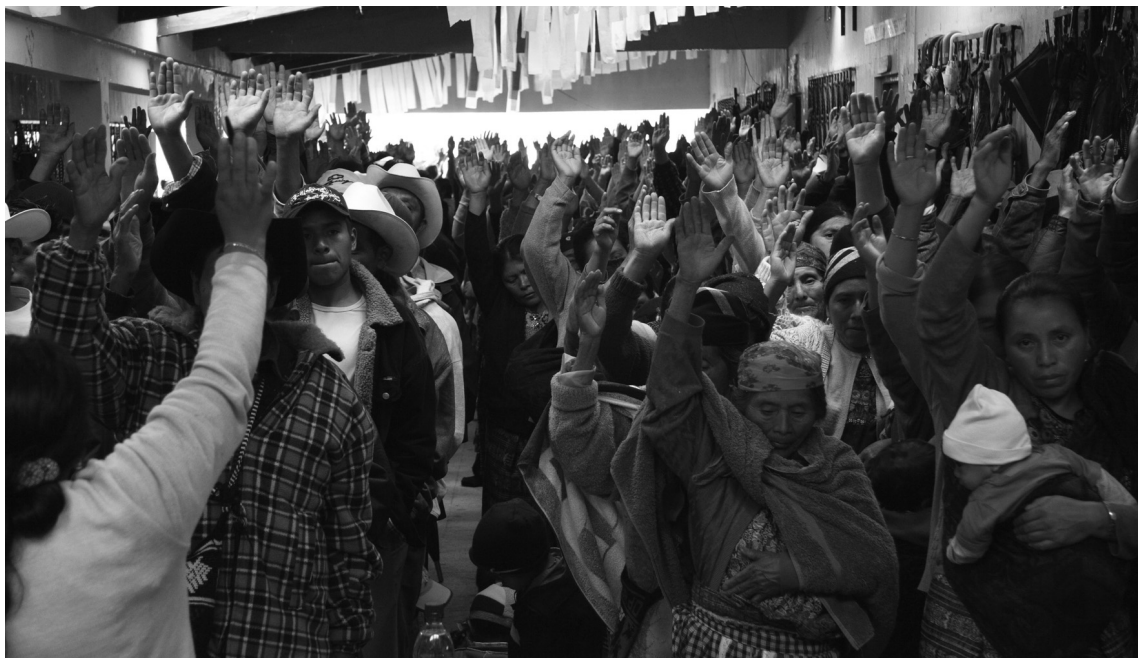
Projecte finançat pel Fons de Solidaritat de la UAB a Guatemala

L'expulsió de la seva terra ha comportat durant segles la pèr-