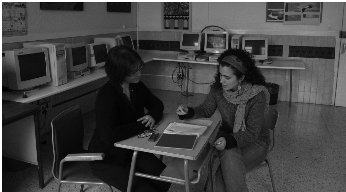
Degut al seu espai reduït, Wad-Ras aconsegueix crear un ambient de familiaritat