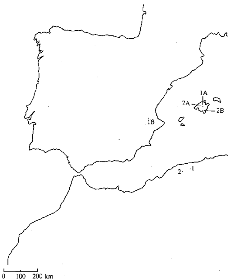
Figura 3. Segmentacions dels B. Watil i dels B. Warifn a al-Andalus. 1.: Banū Watil; 2. Banū Wārifn; 1A: Huatel, alqueria del guz d'Inkân; 1B: Benicadell (Bèlgida, València); 2A: Yarfān, alqueria del guz de Bunyula; 2B: Huarfan, alqueria del guz de Muntuy.

proximitat de la costa amb importants ports comercials actius ja en època romana 25 fa possible desplaçaments col·lectius d'aquest tipus.