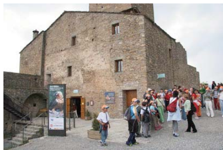
Escolares en el Eco Museo del Castillo de Aínsa

Dicho edificio se destinará a Centro Internacional del Voluntariado, dentro del proyecto de Scouts de Aragón de