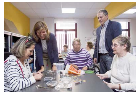
Convenio con el centro asistencial de FADEMA