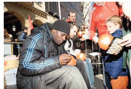
Acto de la Fundación Basket Zaragoza con niños