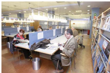
Biblioteca CAI Mariano de Pano

La Sala Infantil, abierta en 2009, continuó con una extensa oferta de lectura y entretenimiento en un espacio independiente para los más pequeños. En 2010 se realizaron en esta sala 17 talleres y 10 proyecciones de cine, así como el cuarto concurso de pintura y lectura de libros. Además se colaboró con 8 centros educativos, permitiendo visitas en las que los escolares pudieron conocer de primera mano el funcionamiento de una biblioteca.