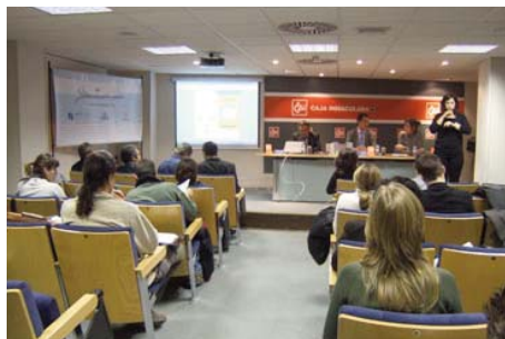
Escuela de Negocios CAI en Huesca

Además se realizaron 35 actividades en colaboración con empresas, instituciones o asociaciones, en las que participaron 775 personas.