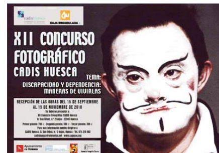
Cartel del concurso fotográfico CADIS Huesca 2010