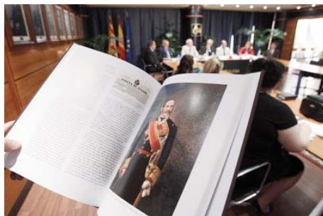
Presentación libro "Valentín Ferraz y Barrau"

Las actividades que más se potenciaron fueron las de Casa Abierta (organizadas por entidades externas) y los programas en colaboración, lo que consolida la vocación de servicio a las entidades sociales zaragozanas del Centro y de la Fundación CAI-ASC. Tanto el número de proyectos educativos como el número de entidades participantes tuvieron un notable incremento.