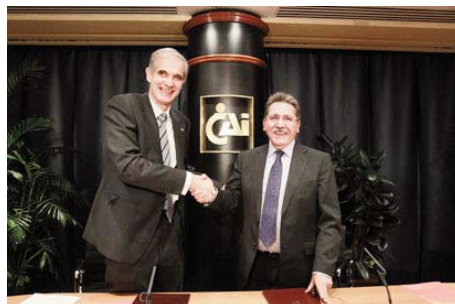
Firma del convenio con la Cámara de Zaragoza para el desarrollo del programa Elcai