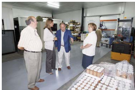
Convenio para la rehabilitación de las instalaciones de la Fundación Banco de Alimentos

En colaboración, desde 1978, con Cáritas Zaragoza, y por medio de la Obra social “Asistencia Social CAI La Inmaculada”, Caja Inmaculada proporciona los medios económicos necesarios para atender a ancianos con escasos recursos y generalmente con precaria salud, y así procurarles una calidad de vida digna sin tener que abandonar su domicilio. El Servicio les proporciona comida todos los días del año, siguiendo una dieta equilibrada, de acuerdo con las prescripciones médicas y en condiciones sanitarias convenientes de conservación e higiene. En 2010, este servicio se amplió con el Programa “Acompañamiento domiciliario y comunitario”.