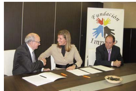
Firma del convenio de colaboración con la Fundación Impulso