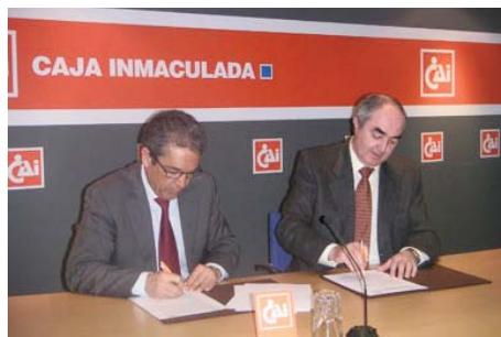
Firma convenio con FUNDESA