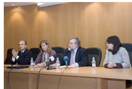
Firma del acuerdo con la Fundación Antonio Gargallo