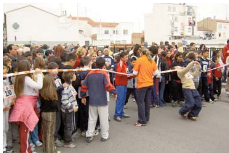
Actividades de la Fundación ADUNARE