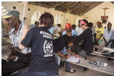
Bomberos Unidos Sin Fronteras en Haití