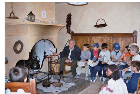
Escolares en espacios de la Comarca del Sobrarbe