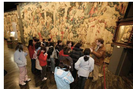
Visitas de escolares al Museo de Tapices en la Catedral de La Seo