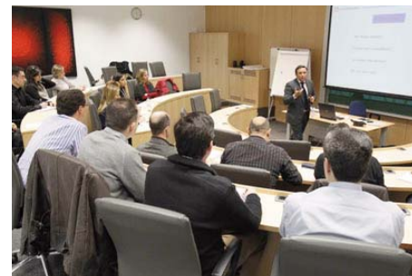
Escuela de Negocios CAI en Zaragoza