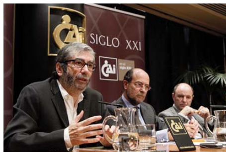
Conferencia de Muñoz Molina en el V Ciclo CAI en el Siglo XXI