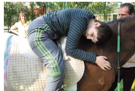
Actividad de la Fundación Genes y Gentes