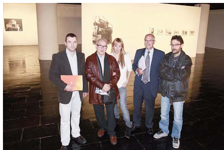
Exposición Proyectaragón en la Sala CAI Luzán

La sala Barbasán en Zaragoza y la sala CAI de exposiciones de Huesca dieron continuidad a sus programas de exposiciones orientados a acercar al público aficionado la obra de jóvenes artistas.