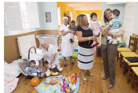
Convenio de colaboración con el centro Casa Cuna de AINKAREN