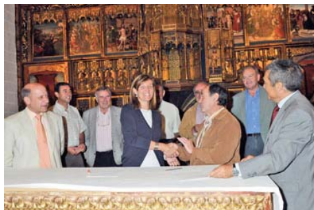
Firma convenio con la Asociación de Amigos de la Colegiata de Bolea

En mayo de 2010 finalizó la tercera edición del programa CAI de visitas escolares a La Seo y al Museo de Tapices. En esta edición, 1.498 escolares de 24 centros participaron en las visitas. En las tres campañas han participado un total de 4.305 alumnos. En diciembre se puso en marcha la cuarta edición del programa, que se desarrollará a lo largo de 2011.