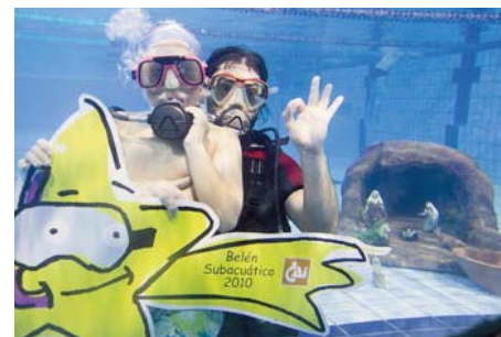
Belén Subacuático de Bomberos Unidos Sin Fronteras