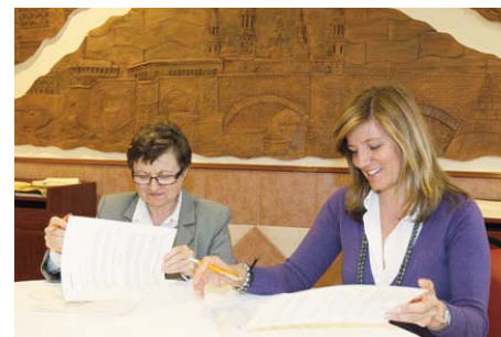
Firma convenio con Fundación Picaral