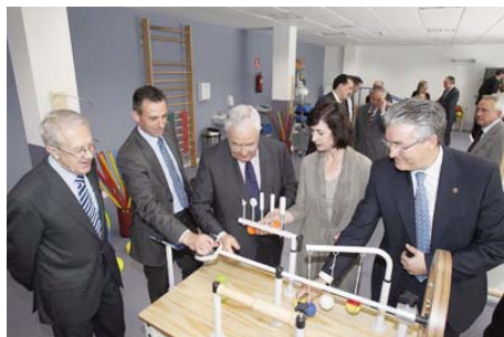
Inauguración del centro CAI Ozanam Oliver

Se firmó convenio para rehabilitar las instalaciones que la Fundación Banco de Alimentos de Aragón tiene en Mercazaragoza. Esta aportación permitió a la Fundación realizar las obras de la acometida de agua potable necesaria para desarrollar su actividad y acondicionar la nave en la que almacenan los alimentos.