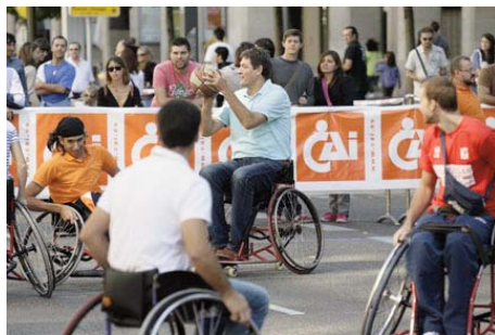
Partido de baloncesto de CAI Deporte Adaptado en la Celebración del 30 Aniversario