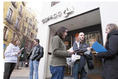
Biblioteca Espacio CAI

Se colaboró junto al Gobierno de Aragón en el congreso que bajo el lema “Aragón, la tierra que nos une” se celebró en octubre en Zaragoza.