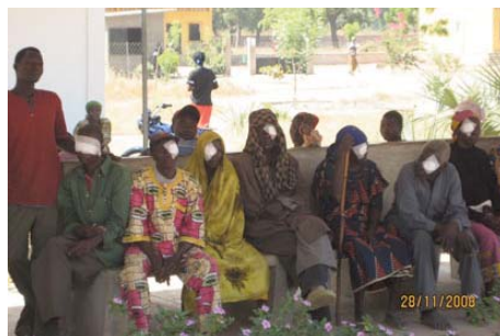
Programa “Luz a tus ojos” de Ilumináfrica