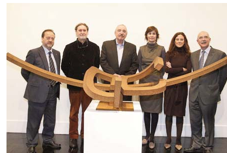
Exposición de Faustino Aizkorbe en la Sala CAI Luzán

En teatro se contaron con distintas obras en gira: “Los peces no vuelan” o “Blanca invisible” y teatro para niños en tiempo de Navidad (“Dulces sueños”).