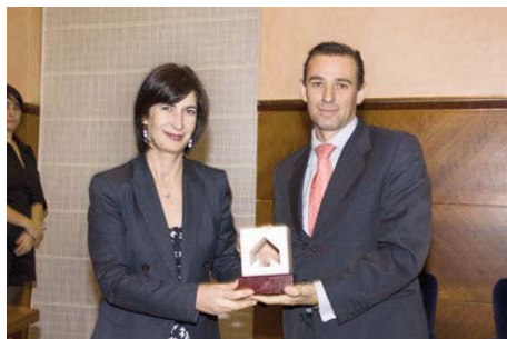
Entrega de los premios Zangalleta de DFA a Caja Inmaculada