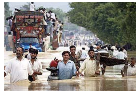
Inundaciones en Pakistán