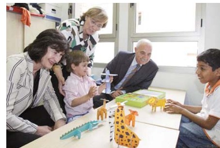
Inauguración del espacio de conciliación familiar del Centro CAI-ASC Joaquín Roncal