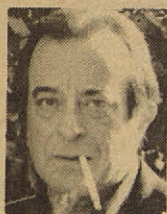
JOSÉ AGUSTÍN GOYTISOLO Escritor.