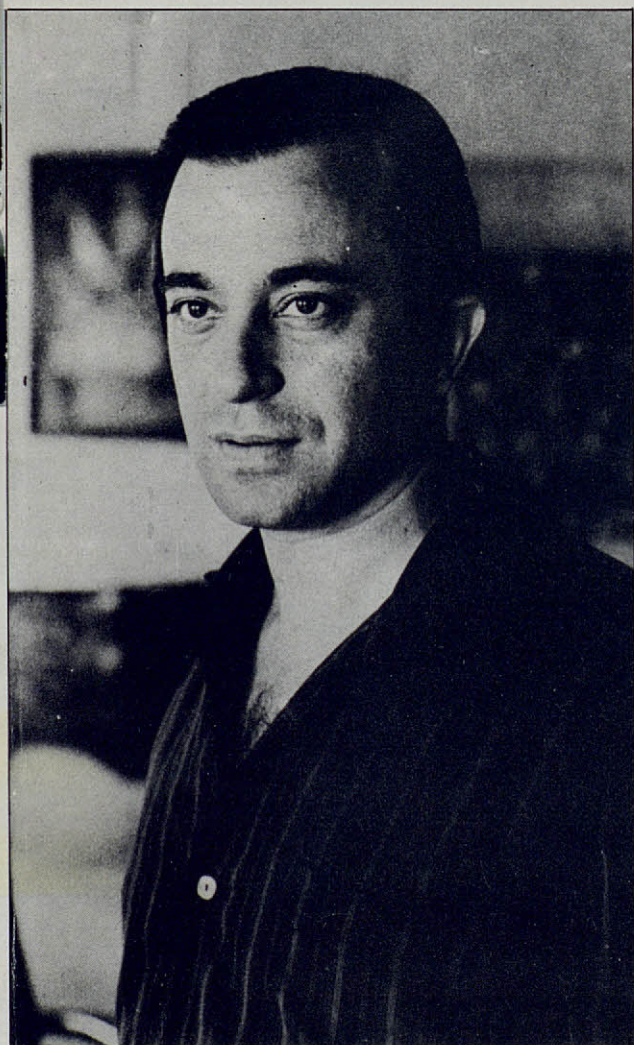
◀ José Agustín Goytisolo.

José Agustín Goytisolo, poeta, ensayista, traductor, crítico, literario y hombre dedicado a la arquitectura desde hace muchos años, es además Licenciado en Derecho por la Universidad de Madrid, y tiene el título de Profesor Mercantil.