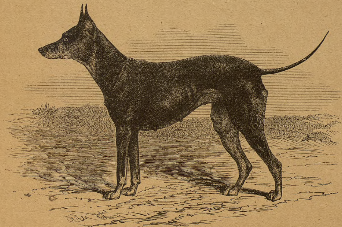
Perro Blak and tan terrier.

Nos causa verdadera satisfacción el entusiasmo que se ha iniciado en Córdoba, Zaragoza, Sevilla y en otras capitales á