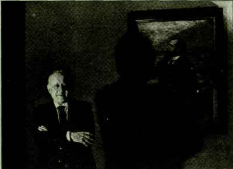
El líder del PNV, Xabier Arzalluz, fotografiado junto a un retrato de Sabino Arana.

En este contexto, el presidente del PNV se refirió a Euzkadi como «un pueblo dividido», y señaló: «No creo que los vascos nos hayamos portado mal con la gente de fuera y, sin embargo, ahora parece que éstos quieren apropiarse de nuestro país. No puede concebirse que por los votos se conviertan en dueños de nuestra casa, que así se vaya perdiendo nuestra identidad, ya que a