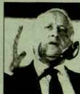
Página 5 Xabier Arzalluz

Por otro lado, el presidente del PNV se mostró «perplejo» por los últimos asesinatos perpetrados por ETA la pasada en San Sebastián, a los que calificó de absurdos, añadiendo que «mis autores viven en otro mundo». Arzalluz agregó que los etarras «hacen todo lo que pueden para demostrar que todavía viven».