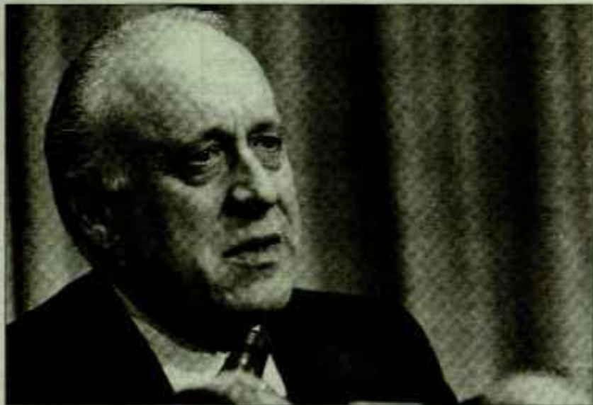
El presidente del Partido Nacionalista Vasco, Xabier Arzalluz, en Tolosa.

El presidente del PNV, afirmó con rotundidad que «Europa es necesaria, y el futuro de Euskadi tiene que ir encajado dentro de esta realidad europea, porque no nos queda otra alternativa». Añadió, al respecto, que la clave del futuro para el País Vasco es «el comportamiento que tendrá nuestro pueblo, la fe que puede mostrar en su