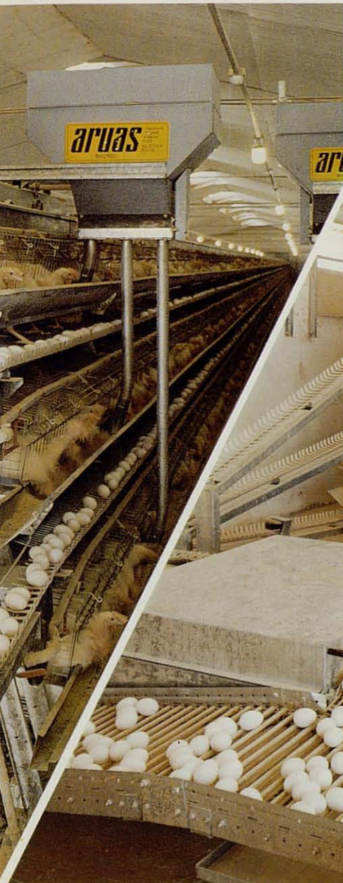
Distribución de pienso por tolvas móviles. Reparten pienso fresco bien mezclado a cada gallina.

Esta especial concepción permite conducir los huevos al final sin movimientos salvando los desniveles sin ninguna rotura permitiendo conseguir huevos sin grietas y consiguiendo menos huevos sucios y rotos.