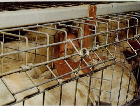
Bebedero de copa muy eficiente, autolimpiante. Todo el frente es puerta, que facilita el manejo de aves.

ARUAS ofrece el nuevo sistema de recogida de huevos por «cadena de cucharillas» y otros sistemas, en diversos modelos de baterías