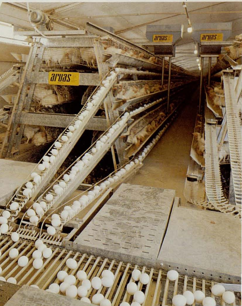
Transportador general de huevos hecho en nylon y fibra de vidrio. Ideal para el transporte desde las baterías al centro de envasado. Varillas de plástico insertadas en cadenas, hacen una superficie ideal para transportar y cambiar de nivel los huevos hasta su destino.

Esta especial concepción permite conducir los huevos al final sin movimientos salvando los desniveles sin ninguna rotura permitiendo conseguir huevos sin grietas y consiguiendo menos huevos sucios y rotos.