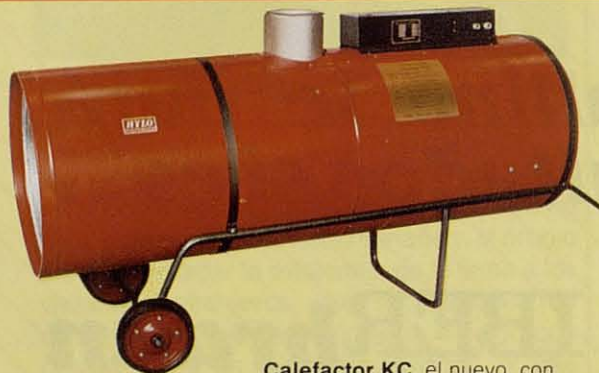
Calefactor KC , el nuevo, con chimenea, también a gas o gas-oil.