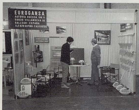
El stand de otra firma española que completaba la muestra de los de nuestro país, aparte de los de material cunícola.

vez más común: la de ir hacia arriba en cuanto el número de pisos con el fin de concentrar una cantidad superior de gallinas en el local. Y, ni que decir tiene, todas ellas equipadas con la máxima mecanización en el reparto de pienso, la recogida de huevos y de deyecciones, etc.