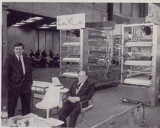
Las magníficas baterías de puesta de una firma navarra, que pueden codearse tranquilamente con las mejores extranjeras.

-Las baterías para el engorde forzado de patos para la producción de "foie-gras", junto con los equipos correspondientes para el embuchado de éstos.