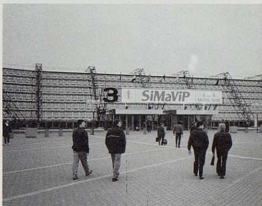
Vista parcial de la moderna construcción del parque de exposiciones en donde se desarrolló la SIMAVIP.

de que, aún habiendo esperándose una cifra de visitantes superior a los 12.000, la amplitud de sus pasillos y los espacios libres que había permitían una visita de la Feria sin ningún agobio. En otro salón contiguo tenía lugar, simultáneamente, el Sitepal, primer Salón Internacional de las Tecnologías y Equipos de la Alimentación Animal y las Industrias Agroalimentarias, organizado también en conjunción con el Salón de la Agricultura.