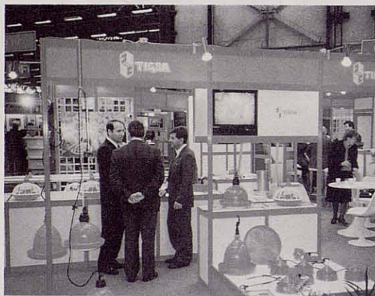
Stand de una de las empresas catalanas de vanguardia en material y equipamientos avícolas, presente en la SIMAVIP 90.

En lo que a la exposición en concreto se refiere, del total de 250 expositores que participaban en ella, una buena proporción pertenecían o se hallaban ligados de una forma u otra al sector avícola. Y, dentro de éste, como ya es habitual en las manifestaciones de este tipo, los fabricantes de equipos avícolas eran los que ocupaban el lugar más destacado, lo cual no excluye el que de los representantes de las granjas de selección productoras de pollitas para la puesta, aves pesadas, pavos, patos o pintadas no faltase prácticamente ninguna de todas aquellas que tienen una dimensión multinacional.