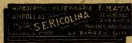
SERICOLINA PURGANTE INYECTABLE