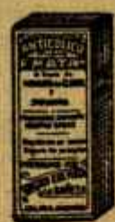
Anticólico F. MATA Cura colica e indigestión en 10-20 min de servida