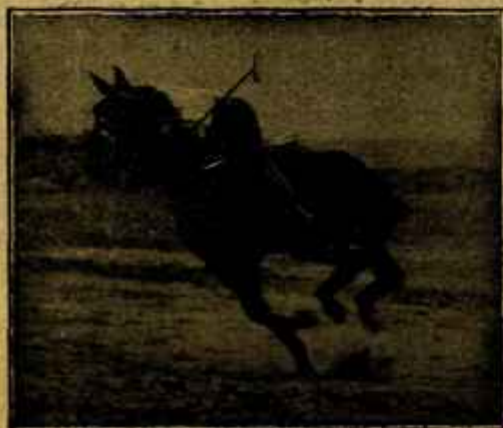
Caballo «Almazarrero» desechado del Ejército por «debilidad senil» jugando un partido de polo a los dos años de haber sido injertado.

El representante de Almería propone que se solicite la formación del Escalafón general de veterinarios titulares, y que a los cargos de veterinarios de sanidad exterior, creados hace muchos años y todavía sin sueldo, se les señale éste o se publique una tarifa de honorarios por servicios. Aprobada la propuesta se solicita hora para visitar al jefe de la Sección de Veterinaria de Gobernación y hacerle presente estos deseos y el propósito de visitar al Excmo. Sr. Ministro de la Gobernación.