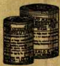
RESOLUTIVO ROJO MATA Poderoso resolutivo e resolutivo