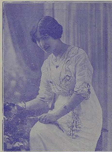
ELVIRA DE HIDALGO