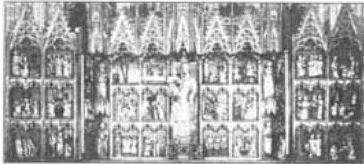
"VIRGEN DE LA BARRILETA" - Anunci al Sant Esperit - 1911 Fotografia de Tortosa.

Concert de la Coral Vicent Ripollés a la S.I.C.B. de Tortosa, amb motiu del IV Centenari Històric del temple episcopal. Tortosa, 1997. Arxiu: JSm