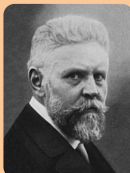
Fig. 3: Alfred Ploetz.

Fundada por Alfred Ploetz, fue la primera organización eugenésica del mundo. Se dedicaba a la discusión de temas de higiene racial, promoviendo la salud y previniendo las enfermedades hereditarias. Se promocionaban las familias saludables y se condenaban el alcohol, el tabaco y las enfermedades de transmisión sexual.