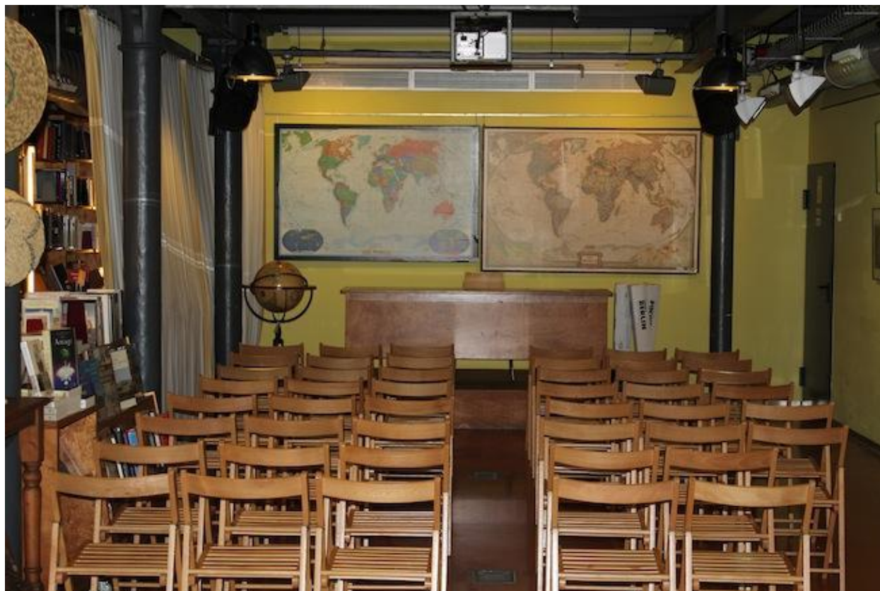
(Espacio para conferencias con el que cuenta la librería)

Cabe prestar especial atención a una de las propuestas que pretenden poner en marcha. La intención es establecer mesas de conversación y debate , integradas en el espacio, con el simbolismo de Altaïr y a disposición de todo el público. Quien quiera podría venir y reservar, por ejemplo una mesa para el miércoles a las diez. Será una mesa de punto de encuentro. Se trata de hacer de este espacio un lugar de contacto. Así, se proponen también contribuir a aquellos que quieran comentar y dar a conocer sus proyectos. Todo lo que podamos potenciar desde aquí, lo apoyaremos.