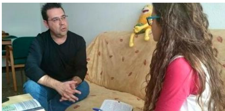
Conversación con el escritor Luís Veá García. (Imagen extraída de la grabación de la entrevista).

El material que se ha logrado reunir resulta de gran utilidad y es el principal motivo por el que la valoración hasta el momento es de satisfacción con el esfuerzo llevado a cabo. Asimismo, al disponer de la filmación de todo el proyecto, en un futuro se podría plantear la realización del reportaje de forma totalmente audiovisual.