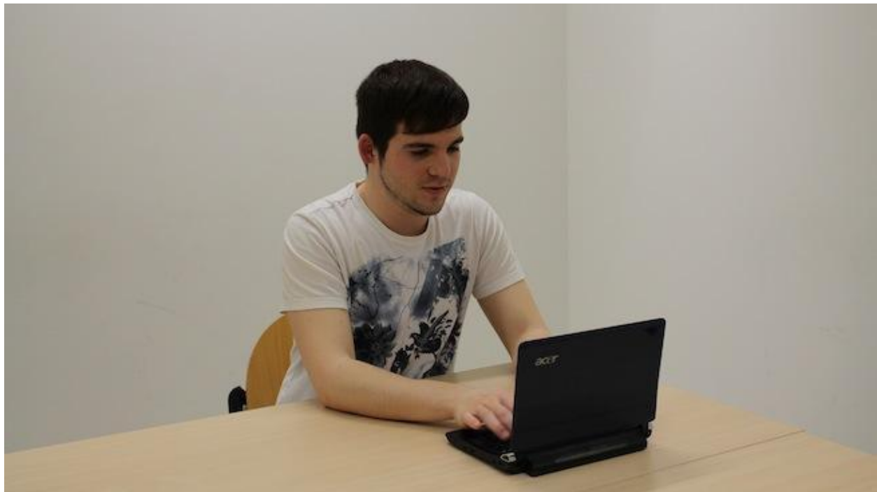
(Fotografía que introduce la entrevista con Albert Alsina)

Melgosa divinifica enormemente el oficio de escritor y mantiene un nivel de exigencia muy alto, ante el cual se ve inferior. Hay un tipo, que no es de mis escritores favoritos pero me cae muy bien, Rafael Reig, dice algo muy interesante: 'se escribe más sin escribir que escribiendo'. Tal vez debería aprender más de ello. Porque escribir es estar pensando y al final piensas tanto en una cosa y te obsesiona tanto, que al final sólo es ponerte y dejarte llevar y luego pues eso, retocar cuestiones estilísticas y gramaticales. Identifica que abrir ese cajón, leer esa novela y tirarla por completo, es el primer paso hacia adelante. Es romper esa barrera. Seguramente es uno de los motivos por los que no llegaré a ser un escritor, por cobardía absoluta. Para ser un escritor hay que ser un valiente. Tal y como yo entiendo el oficio, si no eres valiente no te dediques a eso.