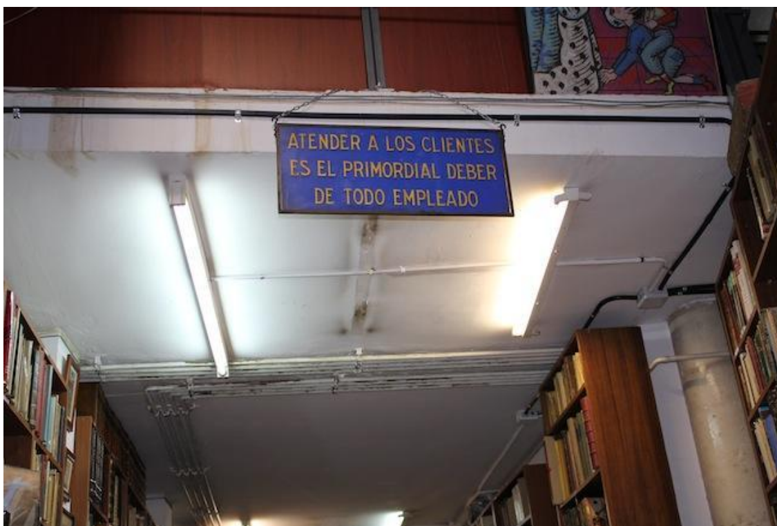
(En el cartel de la entrada de la librería se puede leer: “Atender a los clientes es el primordial deber de todo empleado”)

Asisten a ferias con frecuencia. Acudimos a ferias anuales, como puede ser la Feria de la Calle, en Barcelona en el mes de septiembre. También hay ferias internacionales, en España la Asociación Internacional de Librerías Anticuarías celebramos un evento cada dos años alternativamente entre Barcelona y Madrid. Anualmente también asistimos al Salón del Libro Antiguo, en Madrid; también allí se organizan dos ferias al año en la calle. Todo ello centrándome únicamente en eventos sobre libros antiguos y de segunda mano o de ocasión, habría que sumarle las reuniones en torno al libro nuevo, que se realizan aún más. Es decir, el comercio del libro está vivo.