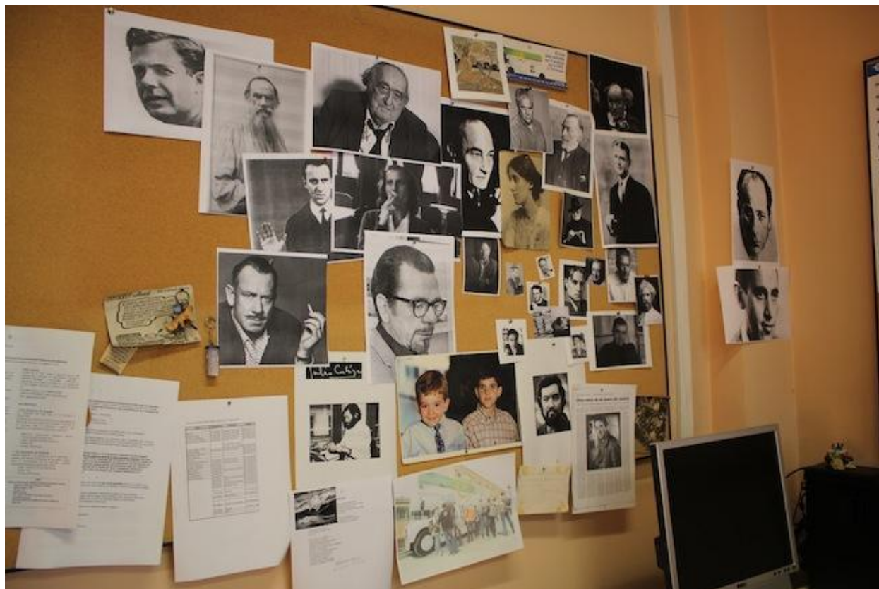
En las paredes de su oficina homenajea a aquellos autores que le inspiran

Empezó su actividad en el blog hace siete años, cuando surgió el mundo del blog. ¿Y por qué decides crear un blog? Me identifico mucho con un escritor de mediados del siglo XIX que se llama Mariano José de Larra, no porque sea ni mucho menos tan bueno como él, que fue uno de los escritores más conocidos de su época. Era un señor que veía el mundo y escribía sobre él, intentó hacer otras cosas literarias y no le salieron, como novela, poesía o teatro, pero lo que le salía genial era precisamente lo que yo llamo cronicuentos que él llamaba artículos de costumbres. Larra tenía el pseudónimo de El pobrecito hablador, a mí se me ocurrió la idea de El pobrecito hablador del siglo XXI. Empecé jugando con digamos la resurrección hipotética de Mariano José de Larra. Escribía y recordaba que yo tenía otra vida y recordaba tiempos pasados y los fundía con el presente.