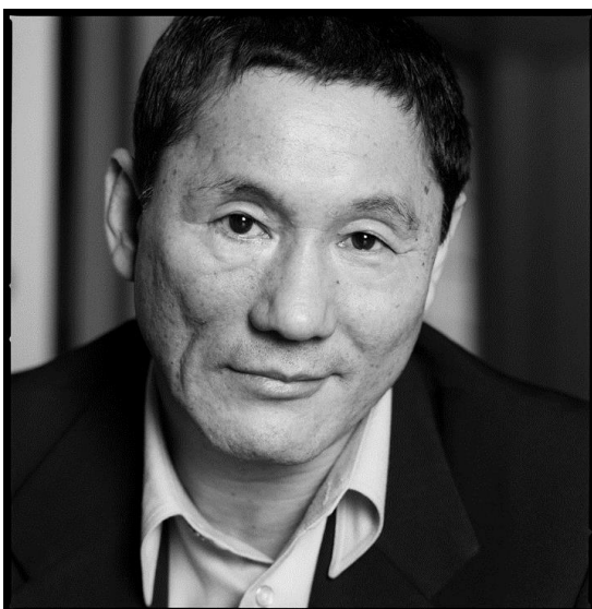
Takeshi Kitano (1947)