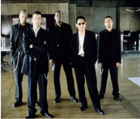
Vestimenta película: Brother