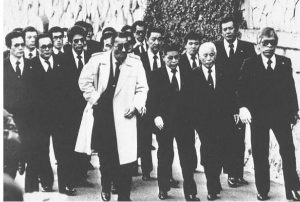
Vestimenta: Clan real Yakuza