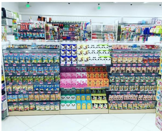
Fotografía 3 Muestra de la disposición de los productos de manera ordenada en las estanterías