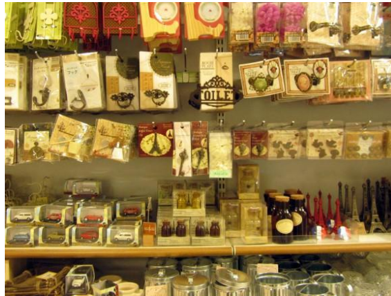
Fotografía 5 Ejemplo de los productos con “estética francesa” de Seria (Buchele Mineta, 2013)

otros países, podría peligrar el puesto líder de Daiso en el mercado. Me atrevo a afirmar tal conclusión puesto que a pesar de que la imagen de Daiso coincide en gran medida con la image que se suele crear en el imaginario sobre Japón en el resto del mundo, es una estética que choca con la que se suele tener especialmente en occidente, ya que se suele dejar para los jóvenes. Sin embargo, la estética de Seria al ser más austera, sin perder el toque adorable, podría encajar más.