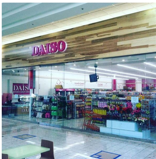
Fotografía 4 Fotografía del exterior de un establecimiento de Daiso en un centro comercial en Seattle (Daiso Oficial USA, Daiso USA South Center Mall, Seattle WA [Imagen] https://www.instagram.com/p/BDJYr-RtmK3/?taken-by=daiso_usa )

Es importante destacar el contraste entre la uniformidad de la organización en el interior de las tiendas Daiso, con la gran variedad de exteriores y decorados que podemos encontrar en los diferentes establecimientos, no sólo dependiendo del país en el que nos encontremos, sino que también dentro del propio Japón, esto puede deberse tanto por las condiciones originales del local en sí, que puede determinar la presencia o ausencia de vidrieras, o el tipo de cartel que debe tener, como por la gran variedad de logos utilizados por Daiso que muy probablemente sea escogido en relación al momento en el que se haya establecido dicha tienda. Este contraste es bastante curioso, porque en las diferentes cadenas de establecimientos alrededor del mundo, la decoración exterior y el logo suelen