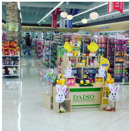
Fotografía 2 Disposición de la tienda con decoración especial para Pascua