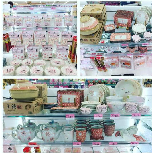
Fotografía 1 Ejemplo de productos estacionales para la primavera con patrones de flor de cerezo