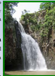
Salto de La Estanzuela