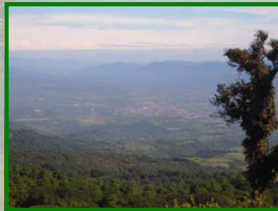
Vistas desde el Cerro Tisey

hacia los lagos (Cuenca del Lago de Managua) y la que va al mar Caribe (Cuenca del Río Coco). También se pueden observar la cadena volcánica de los Maribios y el océano Pacífico.