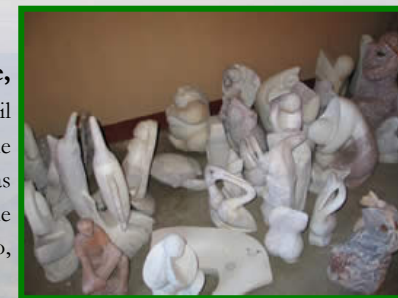
Artesanías de marmolina