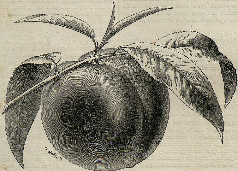
Melocoton GALANDE ó de BELLEGARDE.

La epidermis de su corteza, sobre todo cuando el árbol es jóven, es rojiza, sus flores tienen los pétalos casi blancos y muy grandes, de modo que les hace asemejar á pequeñas rosas; exhalan un olor suave y aromático. En los países templados sus flores aparecen en el transcurso del mes de Marzo. Si la florescencia tiene lugar en buenas condiciones climatológicas, los frutos salen en bastante número; se desarrollan rápidamente, sobre todo en el mes de Junio y Julio, y adquie-