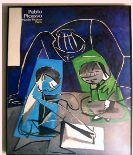
Children writing 1954 Pablo Picasso