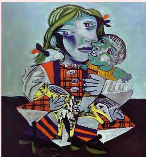
Retrat de Maya amb la seva nina 1938 Pablo Picasso

En la mesura en què el fet de cuidar ha començat a valorar-se o ha passat d'estar desprestigiats a instaurar-se com una activitat apreciada i útil, passant de l'àmbit privat al públic i de reconeixement, moltes professions l'han reivindicat com ho constaten nombrosos estudis actuals des de la filosofia, la sociologia o la psicologia.