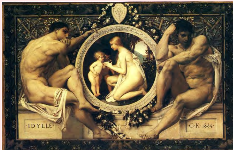
Idylle Gustav Klimt, 1884

Sigui amb aquestes narracions sobre “els orígens” o amb les relacions quotidianes entre mares i fills/es es busca fer-los conscients que no tenen pare, però sobretot que ho visquin amb “normalitat”. Per això, els preparen per “desproblematitzar” l'absència apreciand les diferències entre diferents rols paterns, que no han de coincidir en una mateixa persona, reconeixent l'acompliment d'alguns d'aquests rols per part d'altres persones del seu entorn (parents, amics de la mare, etc.) que, en uns casos, fan a vegades de referents masculins, i, en d'altres, contribueixen a proporcionar-los una rica xarxa social o enfocant la seva vinguda al món (i/o a la família) també com a fruit de l'amor, com succeïa anteriorment amb les narracions sobre els “orígens”.