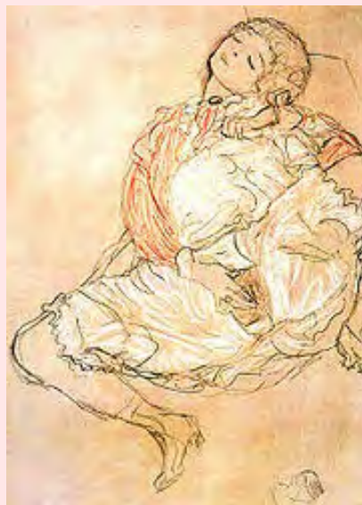
Mujer echada Gustav Klimt, 1916

Els seus fills/es, abans de tot, han de tenir les coses clares i assumir sense ambigüitats “que no tenen pare”. L’explicació coherent del perquè no el tenen prové sempre, per les MSPE, de la narració sobre els seus “origens”, encara que no sempre coincideixin sobre el quan s’ha de fer. Refugiant-se en el que, en la seva opinió, recomanen els ‘experts’ (psiquiatres, psicòlegs, pedagogs), algunes creuen que s’ha d’anar parlant quan els nens/es pregunten o s’adonen de l’absència de la figura paterna, però si no pregunten, és millor no assenyalar aquesta absència, perquè podria significar que necessiten tenir la il·lusió de que el tenen. La major part de les MSPE pensa, tanmateix, que els nens/es han de saber des de sempre que “no tenen pare”.