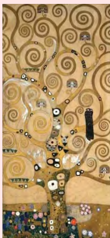
Árbol de la vida Gustav Klimt 1905-09

En les històries sobre "els orígens" que les MSPE per fecundació sexual amb "donant conegut" o per fecundació assistida relaten als seus fills/es, apareix igualment l'amor com un component fonamental dels seus "orígens", tot i que en aquests casos no es tracta de l'amor dels "pares biològics", sinó de la generositat d'un "donant" que va ajudar a la mare a complir el seu desig de maternitat. Aquestes dones són conscients de que els seus projectes monoparentals, això és, les seves "famílies sense pare", van ser escollits per elles, però no pels seus fills/es, raó per la qual alberguen certs dubtes i sentiments de culpabilitat respecte a això i són conscients de que poden (/solen) ser acusades "d'egoistes" per privar-los, voluntàriament, d'un pare, i en el cas de la fecundació assistida, de la possibilitat mateixa de conèixer aquesta persona algun dia.