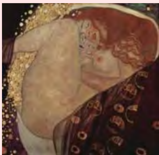
Dánae Gustav Klimt 1907

Aquest projecte familiar requereix que les MSPE, dins la seva recerca de legitimitat davant del model encara dominant de família biparental, hagin d'afrontar l'absència del pare, a través de solucions diverses que depenen de múltiples factors però, principalment de les vies d'accés a la maternitat en solitari: adopció internacional, reproducció assistida o relacions sexuals amb fins reproductius.