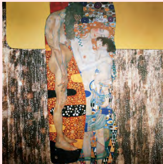
Las tres edades de la mujer Gustav Klimt, 1905

El mateix succeeix amb el qualificatiu de mares "soles" que consideren inadequat perquè recalca l'absència de la figura paterna, com si aquesta fos imprescindible per a les tasques de criança i educació dels fills/es.