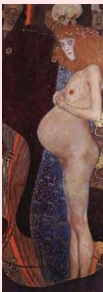
La Esperanza I Gustav Klimt, 1903

Dels aspectes a abordar respecte a les MSPE, aquest és només una part. Altres ja han estat tractats per les autores en altres texts, com les motivacions per seguir una via o una altra d'accés a la maternitat en solitari, el paper dels fòrums on-line en la constitució d'una determinada identitat col·lectiva, les situacions d'apoderament i/o vulnerabilitat en que es troben durant els processos que porten fins a la constitució dels seus projectes familiars, etc. (Jociles y Rivas 2009 y 2010; Jociles, Rivas, Moncó y Villaamil 2010).