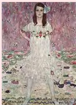
Mäda Primavesi Gustav Klimt 1912

L'altra activitat que les MSPE qüestionen, per l'efecte de carència que pot produir en la percepció familiar dels seus fills/es, és l'elaboració de l'arbre genealògic, que condensa gràficament el nostre sistema cultural de parentesc de base biològica dominant, el fonament del qual són els vincles que s'estableixen entre ascendents i descendents, a partir de la unió sexual d'un home i una dona. El valor explicatiu del genograma és la representació dels parents que conformen la història i biografia familiars del nen/a tant per la branca paterna com la materna. Tanmateix, pels fills/es de les MSPE, això implica la visibilització de la seva família com la "meitat" de la que els altres tenen, en mancar-hi una part, la paterna, que queda en "blanc", "buida". La seva proposta és substituir l'arbre genealògic pel del sol -utilitzat així mateix per altres col·lectius de famílies no convencionals- en el que cada raig representa una persona a la que es considera part de la família, sense tenir en compte l'ordre generacional, l'existència o no de vincle de consanguinitat ni la relació filial paterna i/o materna, el que deixa llibertat total per plasmar cada experiència familiar.