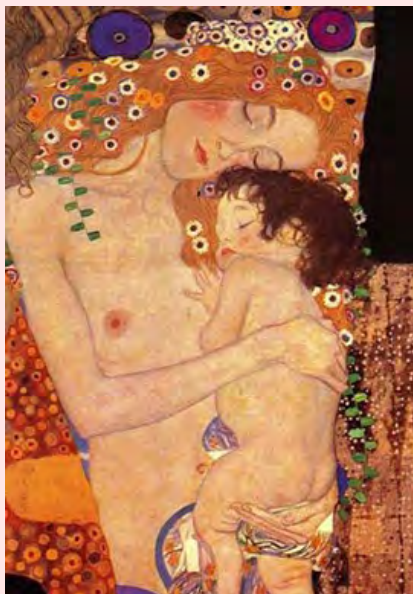
La maternidad Gustav Klimt

A això cal sumar les accions de pressió que exerceixen respecte a les institucions político-jurídiques de cara a atendre les necessitats del seu col·lectiu, ja siguin socials, educatives, sanitàries, etc. Un exemple de les accions que duen a terme és la reivindicació de no ser discriminades en la sanitat pública -pel cas de les que opten per la reproducció assistida- davant les parelles amb problemes de fecunditat, o l'aplicació efectiva del reconeixement com a famílies nombroses a les monoparentals amb dos fills/es que es va aprovar en la Llei de Pressupostos Generals el desembre de 2008 (el que ja els ha estat reconegut en algunes CC.AA com Catalunya).