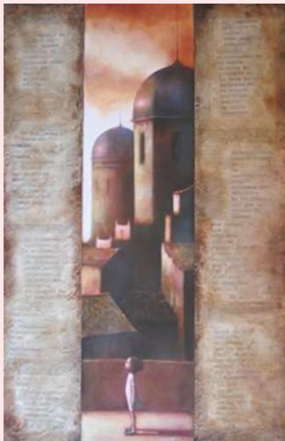
Preguntes a l'aire

La por a que, finalment, la sang tibi... i triomfi.