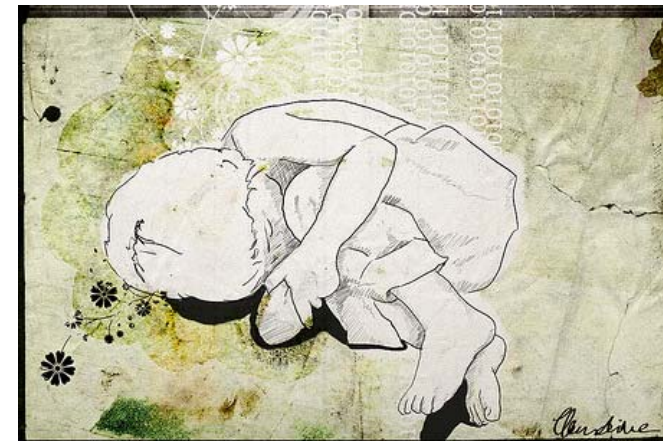
Proyecto FEM2012-33067: Maternidad, tecnología i relación asistencial

Aulario Campus de Ciencias de la Salud de Bellvitge 22 a 24 de Mayo de 2014