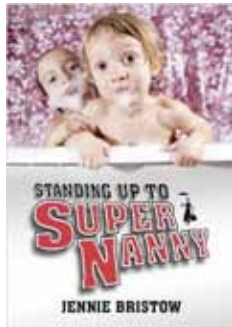
Bristow, J. (2009) Standing Up To Supernanny UK: Imprint Academic

Se'ns diu que la vida familiar requereix que adaptem de manera significativa les nostres vides, emocions i relacions, quelcom que haurem d'aprendre a fer i gestionar. Però, és realment dolent necessitar permanentment classes de criança i orientació? És un mite que els pares d'avui en dia no tenen remei i són mandrosos: en molts aspectes, hem esdevingut massa eficients, amb grans expectatives i volent recompenses concretes, fins al punt que ens desorientem intentant de trobar algun tipus d'intervenció professional per als nostres fills. L'obsessió actual per la criança perfecta dels fills incrementa la nostra inseguretat i la desconfiança mútua, i disminueix la nostra autoritat com a pares. Aquest llibre ens planteja la pregunta: Per què hem de convidar la Supernanny al saló de casa nostra - i com podem fer-la fora?