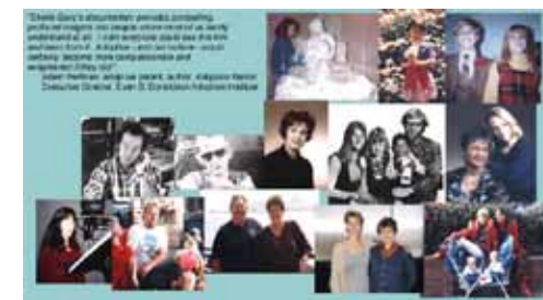
Unlocking the heart of Adoption Documental dirigit per Sheila Ganz EE.UU., 2002

El documental pretén estendre un pont entre les famílies biològiques i adoptives a través de diverses històries personals d'adoptats, pares biològics i pares adoptius, d'una mateixa raça i també en adopcions interracial, que s'entrellacen amb la història de la cineasta en tant que mare biològica, revelant les enormes complexitats de les seves vides amb un fascinant transfons històric.