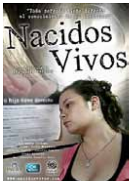
Nacidos Vivos Documental dirigit per Alejandra Perdomo Argentina, 2014