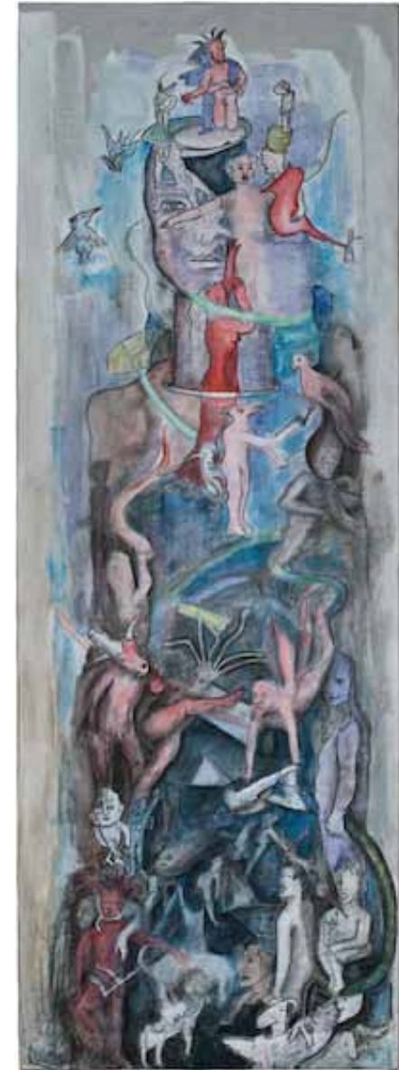
Entonces vi... III. Tècnica mixta sobre lli 2015 136 x 47,5cm.