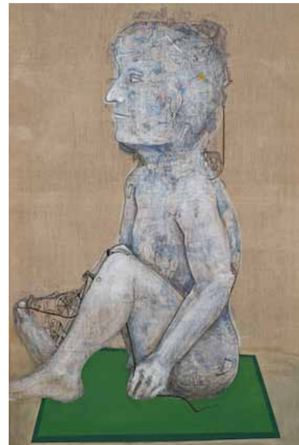
Figura IV. Tècnica mixta sobre lli 2013 167 x 895 cm.

subjectes i pràctiques polítiques que desanimen llurs recerques, aquestes persones volen conèixer els seus orígens biològics i s'organitzen demanant que l'Estat els garanteixi el seu dret a la identitat.