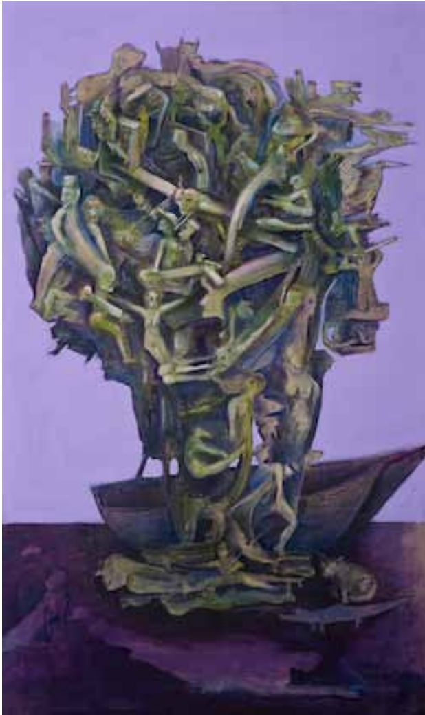
Caronte Acrílic sobre lli 2012 144 x 85 cm.

tres societats, en canvi, a causa de la centralitat donada al moment del coit, a la procreació sexual, qualsevol informació relativa a la concepció provoca una pertorbació immediata en les relacions i en la identitat dels individus perquè aquest tipus de coneixement està lligat a la idea de la "identitat personal".