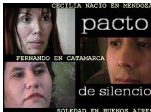
Pacto de Silencio Curtmetratge dirigit per Diego Velazquez Viard Argentina, 2004

Tres històries unides pels mateixos interrogants: a causa de l'adopció il·legal o irregular, l'apropiació de bebès i falses filiacions que van tenir lloc a Argentina, pateixen en no saber res sobre el seu origen, busquen la seva identitat biològica, les seves arrels, la seva prehistòria.