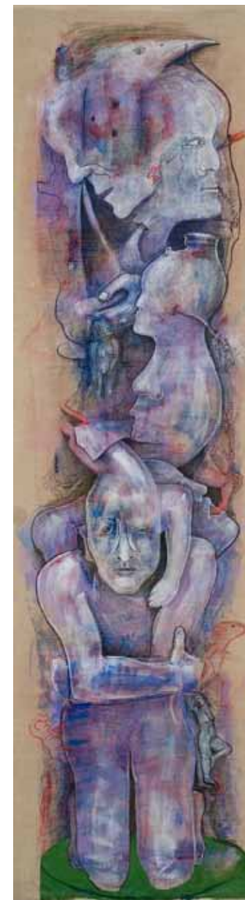
Entonces vi... I Tècnica mixta sobre lli 2014 190 x 56cm.

Preguntar-se a un mateix per l'origen sol ser difícil, sobretot si existeixen dubtes sobre la relació biològica que ens uneix amb els nostres pares, però resulta encara més complex preguntar als pares pel propi origen. Certament, moltes d'aquestes persones que encara avui busquen els seus orí-