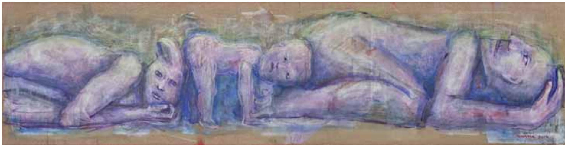
Familia II Tècnica mixta sobre lli 2014

En suma, el treball dels activistes nucleats en aquest tipus d'associacions, en un intent de traduir el seu reclam al llenguatge dels drets i fer-lo públic, aconsegueix produir la politització d'un tema que tradicionalment va ser concebut com una exclusiva qüestió privada, a saber: inscriure un nen o nena com a fill propi, o bé explicar o no explicar al nen/a "adoptat/da" la veritat sobre els seus orígens. En aquest sentit, el treball d'aquestes associacions produeix una politització de la intimitat . Les pràctiques que es qüestionen i denuncien han estat tra-