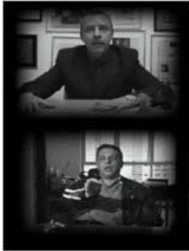
33 Dirigida per Kiko Goifman Brasil, 2004