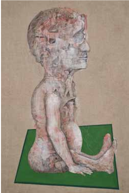
Figura II Tècnica mixta sobre lli 2013 170 x 100 cm.

quals es reconeixen però de les quals també es diferencien. Això és així perquè al nostre país actualment els sentits associats a nocions com "identitat", "orígens" o fins i tot "veritat biològica" es vinculen estretament al reclam de veritat i justícia protagonitzat des de fa més de 35 anys per la Asociación Abuelas de Plaza de Mayo .