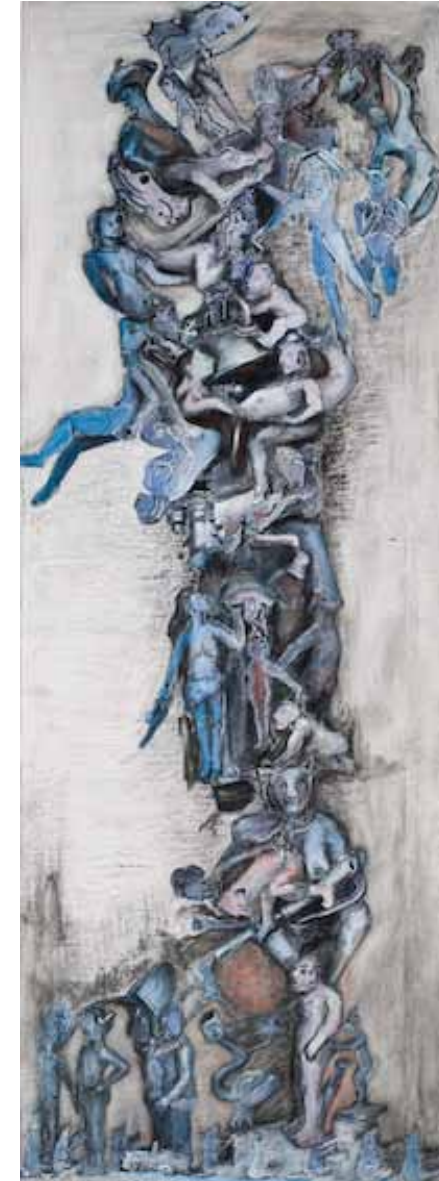
Entonces vi... II Tècnica mixta sobre lli 2015 136 x 47,5 cm.

En suma, aquest tipus d’organitzacions, més enllà de tenir una causa comú que es pot resumir en l’objectiu de conèixer els orígens, adquireixen singularitats depenent dels contextos polítics, socials, històrics i econòmics dels països on es desenvolupen. A Argentina, les recerques que emprenen aquestes persones tenen la particularitat que dialoguen amb altres, en les