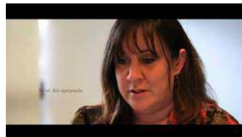
Derecho a la Identidad de Origen y Biológica Curt de difusió sobre el projecte de llei Argentina, 2013

El projecte de llei busca facilitar la tasca d'aquelles persones que emprenen la recerca de la seva identitat d'origen o biològica o la d'algun parent proper, com a conseqüència del desconeixement o d'haver-los estat sostreta. Es calcula que prop de 3 milions de persones en aquest país no coneixen la seva identitat d'origen o biològica. Amb el present projecte es pretén abastar i garantir el dret inalienable de totes les persones a conèixer la verdadera identitat d'origen i biològica, pròpia o dels seus ascendents, descendents o col·laterals, la qual cosa és un dret constitucional.