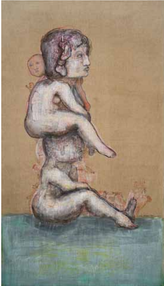
Familia Tècnica mixta sobre lli 2013

gens no han parlat del tema amb els seus "pares de criança".