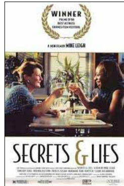
Secretos y Mentiras Dirigida per Mike Leigh Regne Unit, 1996