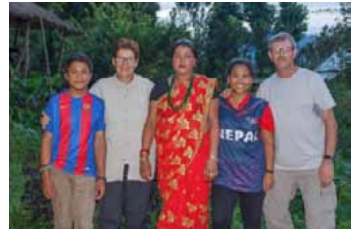
Chandra amb les seves dues famílies.