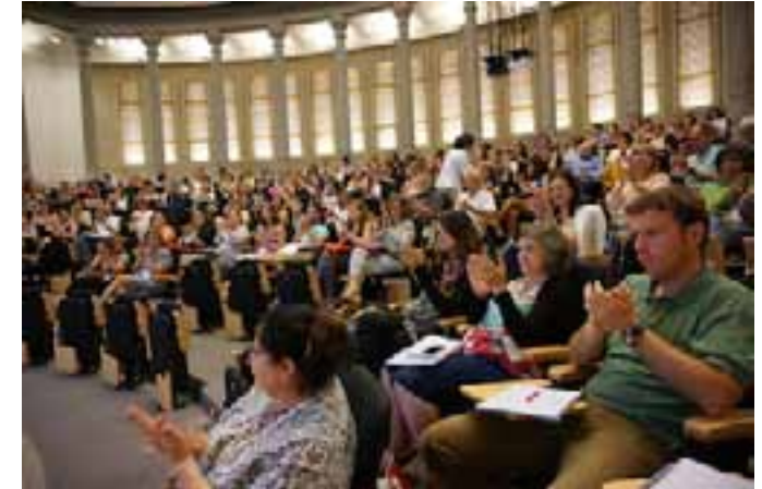
Imatge del públic durant una de les sessions del VII Congrés Iberoamericà d' Investigació Qualitativa en Salut.

i la història de la salut i la justícia reproductiva, explicaren els reptes que van suposar les respectives investigacions en relació amb els comitès ètics i l'accés a 'informants clau' durant el treball de camp. Del debat van emergir dues grans conclusions: d'una banda, la necessitat d'equilibrar el poder dels comitès ètics que limiten la investigació a determinats temes i les aproximacions des d'una perspectiva política concreta i, d'altra banda, la necessitat de formar-se i compartir experiències en la gestió de les dificultats dels protocols ètics en els projectes d'investigació.