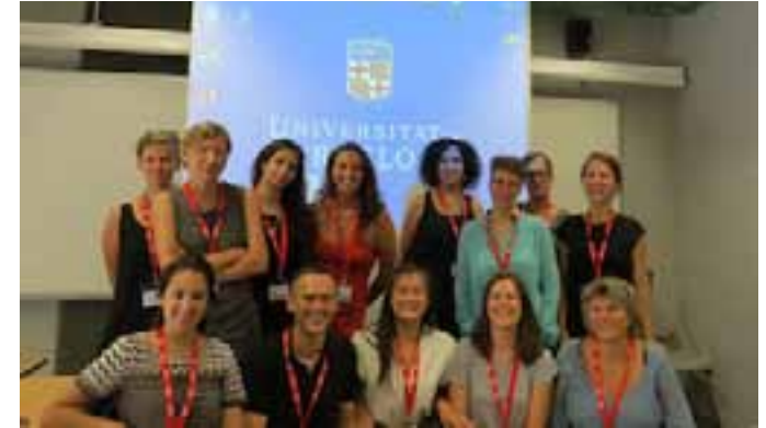
Participants del doble panel "Making Kinship: Technology, Bio-politics, and Reproductive Justice".

Aquests temes de debat emergiren de les comunicacions que van tractar temes com les pràcti-