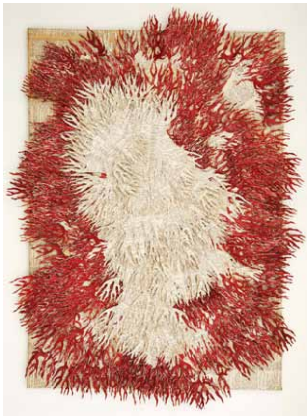
Campo semántico I

en la cabeza y es que me dicen de cortarme el pelo, es como si me arrancasen mi alma, como que me quitasen la vida, porque me acuerdo yo que tenía el pelo, era pequeña, tenía el pelo muy largo, con flequillo, muy mona, y a mí lo que se me ocurrió fue cortarme el flequillo y dijeron, "espérate" y me corta-