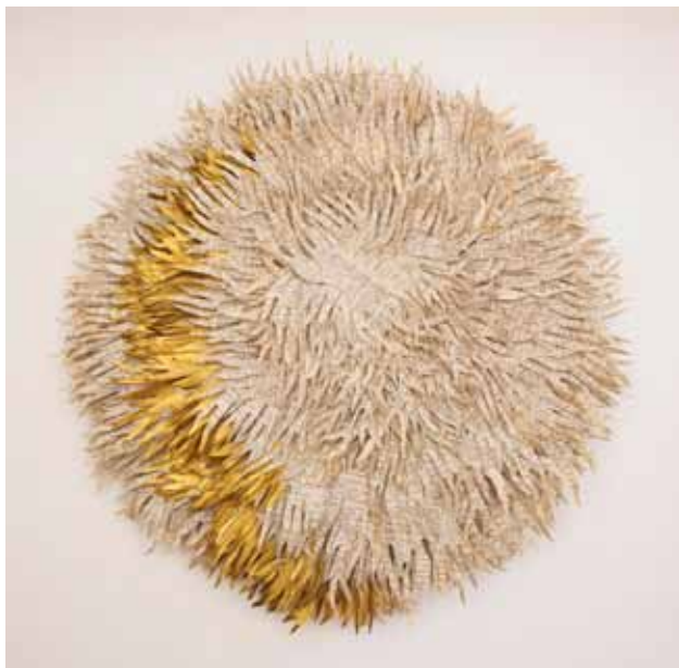
Campo semántico II

el pare, com hem assenyalat anteriorment, no semblava que acceptés que la seva filla estava creixent i que les normes de la infància no servien per a l'adolescència, en la qual es fa necessari redefinir les relacions. Per ella la relació amb la parella "[va] muy bien, yo empecé con diecisiete, él con dieciocho, claro. Yo era un año menor, pero bueno, bien. La relación súper bien. [...] Llevamos juntos un año y siete meses, "que los vamos a cumplir el 24 de agosto" [...] Me ha ayudado en todo..."