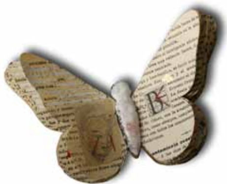
Libro de artista

la qual segueixen convivint perquè, en aquell moment, José decideix quedar-se amb els seus pares. Els progenitors no estaven d'acord amb aquesta mesura i demanaven contactes més freqüents amb els seves filles i el fill.