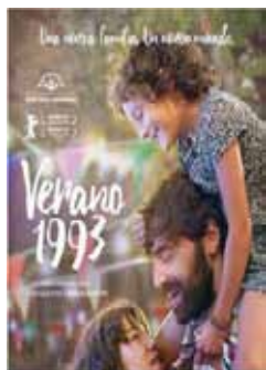
Simón, C. (2017) Verano 1993 Espanya, 97 min