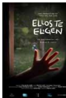
Levit, M. (2015) Ellos te eligen Argentina, 62 min