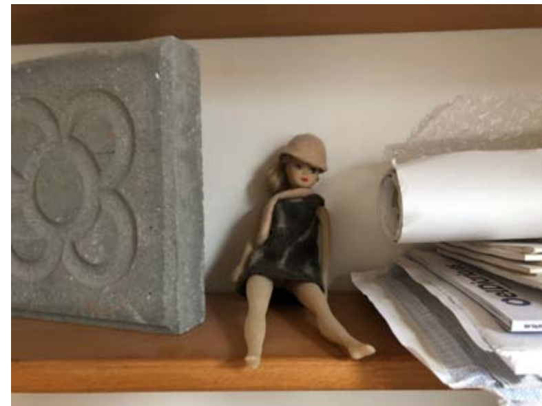
La més fuerte.

Quelcom similar experimenten les migrants indígenes, les quals tampoc estan del tot familiaritzades amb els tràmits. Aquest tipus de migrants –el domini de l'espanyol de les quals pot ser limitat– poden tenir dificultats per comunicar-se amb el servei públic, particularment quan aquest últim és poc empàtic. Aquesta situació també l'experimenten, per exemple, les emprenedores haitianes.