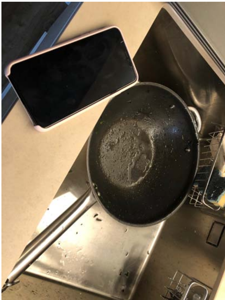
Come y trabaja.

com a subjectes socials actius; tanmateix, les vulnerabilitats comparteixen un origen comú: la cultura patriarcal que impacta limitant les emprenedories de les dones.