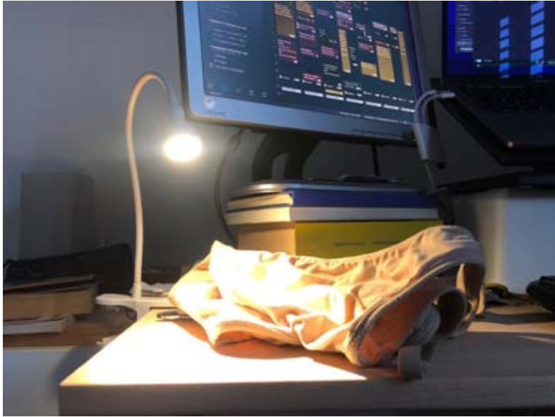
Meetings sin bra.