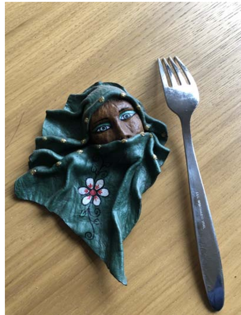
La dueña del restaurante.

Les emprenedores de la frontera també experimenten limitacions per accedir a un possible finançament. Algunes emprenedores entrevistades ens han parlat sobre la prevalença d'estereotips de gènere