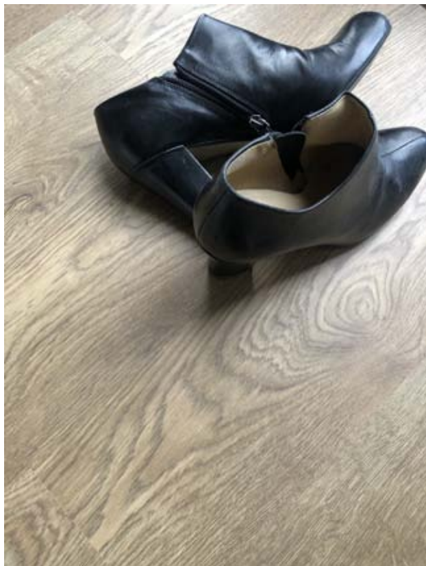
Volviendo del banco.

i l'enorme cost dels crèdits bancaris com a aspectes negatius per als seus negocis. De la mateixa manera, l'obtenció de suports públics tampoc resulta accessible. Aquesta situació és, sobretot, viscuda per emprenedores rurals de Mexicali, que no disposen de propietats, ja que aquestes solen estar a nom dels marits, parelles o