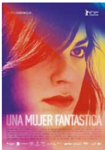
Lelio, S. (Director) (2017) Una mujer fantástica Xile 104 min

Marina, una jove cambrera aspirant a cantant, i Orlando, vint anys més gran que ella, planegen un futur junts. Després d'una nit de festa, Marina el porta a urgències, però ell mor en arribar a l'hospital. Llavors, ella s'haurà d'enfrontar a les sospites generades entorn de la seva mort. La seva condició de dona transsexual suposa per a la família d'Orlando una completa aberració i ella haurà de lluitar per convertir-se en allò que és: una dona forta, passional... fantàstica. (FILMAFFINITY).