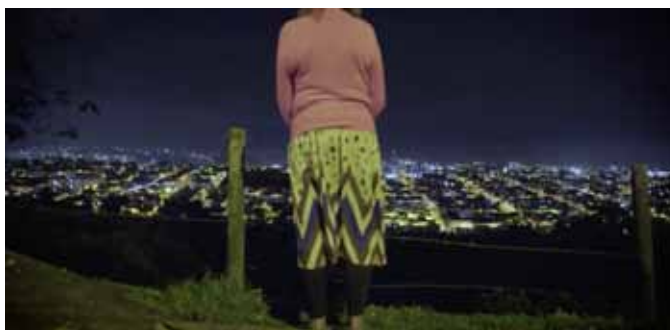
Moya, M. (Directora) (2011) ¿Putas o peluqueras? Más allá del estigma [Documental] Colòmbia, 52 min

Marina, una jove cambrera aspirant a cantant, i Orlando, vint anys més gran que ella, planegen un futur junts. Després d'una nit de festa, Marina el porta a urgències, però ell mor en arribar a l'hospital. Llavors, ella s'haurà d'enfrontar a les sospites generades entorn de la seva mort. La seva condició de dona transsexual suposa per a la família d'Orlando una completa aberració i ella haurà de lluitar per convertir-se en allò que és: una dona forta, passional... fantàstica. (FILMAFFINITY).