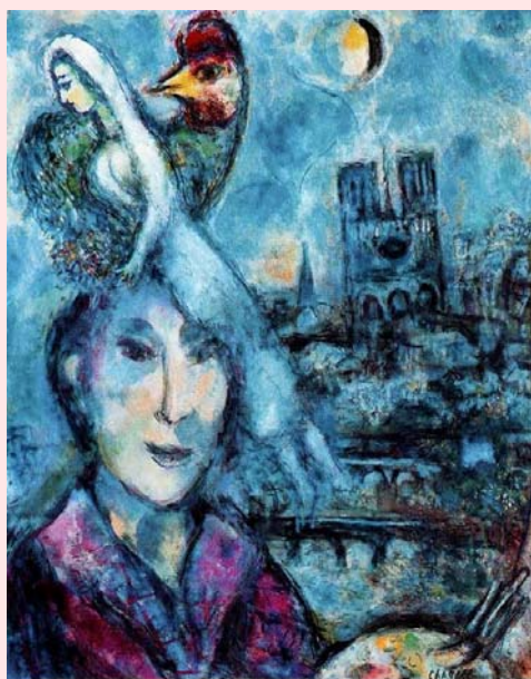
Autoretrato 1959- 1968 Marc Chagall

Motivos que hacen que resulte absolutamente imprescindible que se exija una formación especializada permanente a los profesionales involucrados en estos procesos. Formación que debe incluir una profundización en las particularidades y especificidades de la creación de familias por medio de la adopción, y que incluya también el conocimiento de los avances internacionales recientes en pediatría, neurología, psicología, en las teorías de creación de vínculos y en el desarrollo del apego, para poder garantizar que el apoyo prestado a las familias adoptivas sea realmente eficaz.