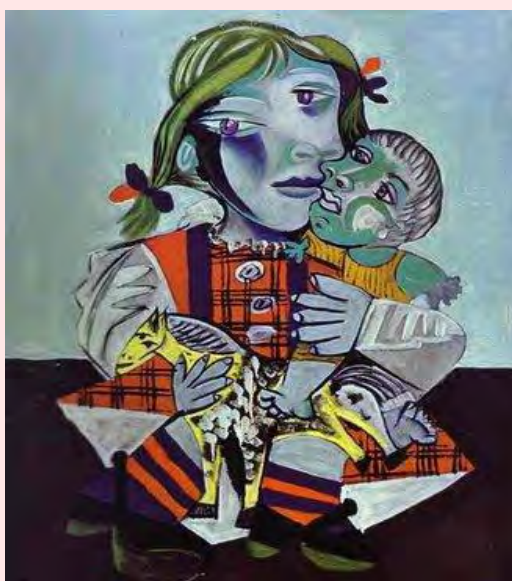
Retrato de Maya con su muñeca 1938 Pablo Picasso

En la medida en que el cuidar ha comenzado a valorarse o ha pasado de estar desprestigiado a instaurarse como una actividad apreciada y útil, pasando del ámbito privado al público y de reconocimiento, muchas profesiones lo han reivindicado, como lo constatan numerosos estudios actuales desde la filosofía, la sociología o la psicología.