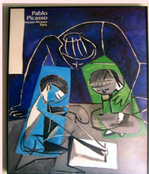
Children writing 1954 Pablo Picasso

Cuando Borneman (2001) criticó las categorías del parentesco, poder, género, matrimonio y sexo, propuso dar más importancia a formas variables que incluyen otros procesos y no privilegian las formas de reproducción comunitaria.