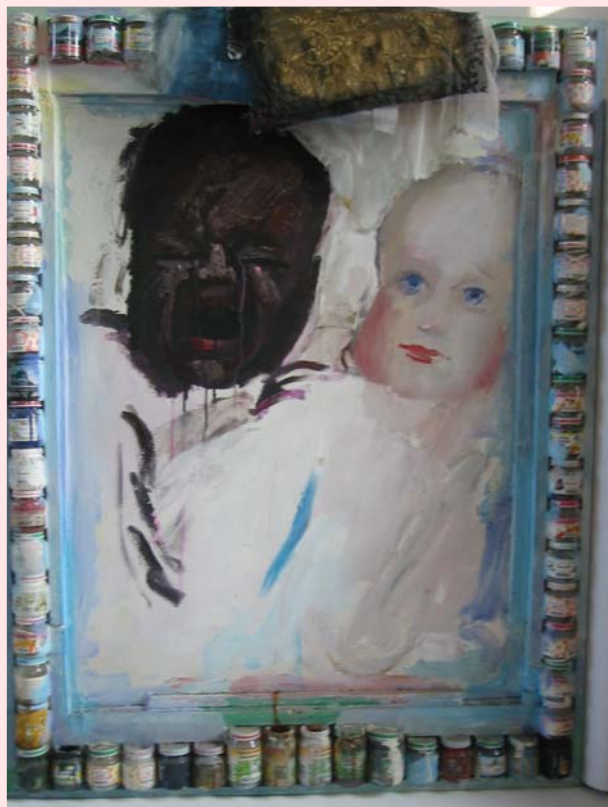
Derrière le Rideau, 1995 J.Grau-Garriga

Porque no nos conformamos con los discursos ya aprendidos y porque no somos felices en un mundo fragmentado, AFIN nace con actitud valiente e inclusiva.