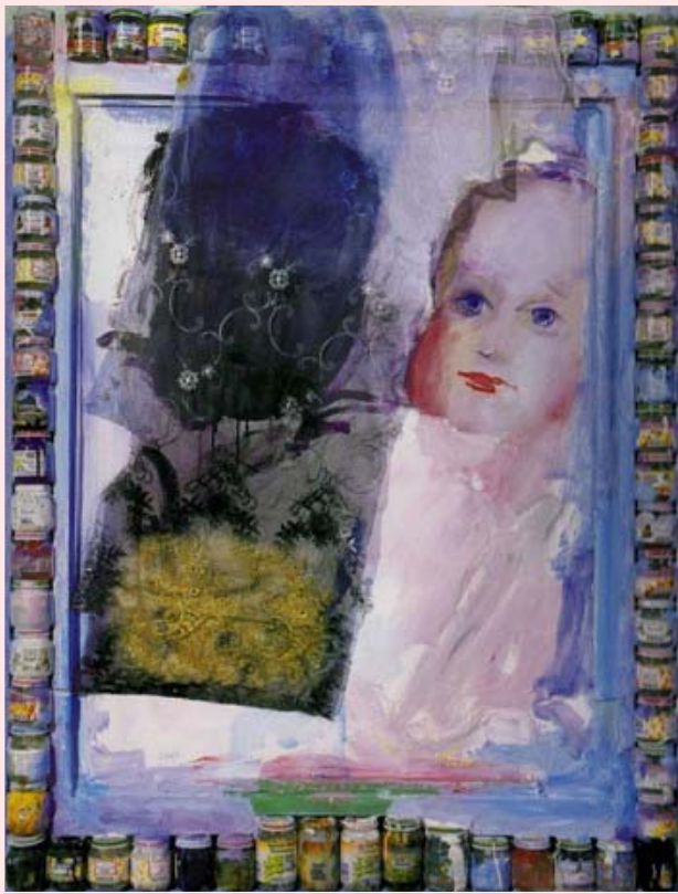
Derrière le Rideau, 1995 J.Grau-Garriga

Este es un nuevo espacio desde donde descubrir y compartir nuevas miradas en torno a temas sociales que nos preocupan o, mejor, que nos ocupan. Nuestra labor de investigación y difusión sobre temas relacionados con las adopciones, las infancias y juventudes y las familias, se ha concretado a través del proyecto I+D Adopción Internacional: la integración familiar y social de los menores adoptados internacionalmente. Perspectivas interdisciplinarias y comparativas financiado por el Ministerio de Ciencia e Innovación (SEJ2006-15286/SOCI), que llevamos a cabo un amplio equipo de investigadores y asesores provenientes de diversas disciplinas, actividades profesionales e instituciones, desde hace dos años.