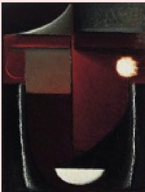
Abstract Head: Inner Vision- Red-Black