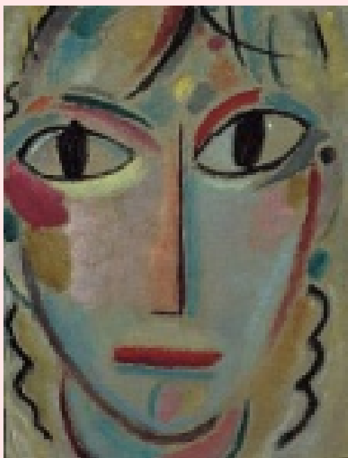
Astonishment, 1919 Alexej Von Jawlensky

Después de estos 15 años, en los que la adopción internacional ha seguido un patrón de crecimiento exponencial y continuado en solicitudes de adopción y en adopciones constituidas - patrón que ciertas voces han considerado desmesurado y poco reflexivo-, nos encontramos frente