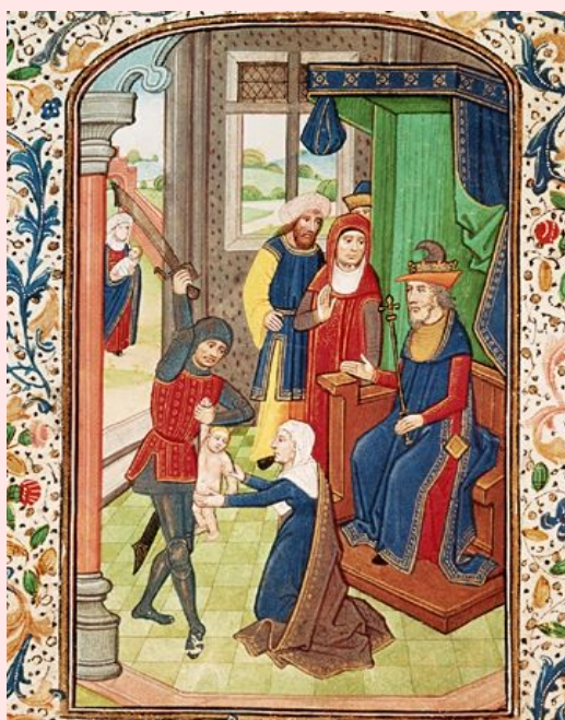
El Juicio del Rey Salomón, Ilustración renacentista