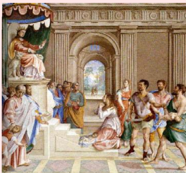
El juicio de Salomón

Quienes trabajamos con menores que han vivido situaciones de desamparo, sabemos que sus madres suelen ser mujeres que comparten alguna de las siguientes características: desprotección social, salud mental precaria, dependencia de tóxicos, parejas afectivas inestables, violencia de género y una infancia, la mayoría de las veces, difícil.