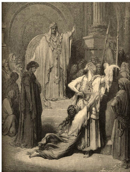
El juicio de Salomón

¿Recordamos estas fases cuándo aplicamos medidas de protección? Si fuera así, sería muy improbable que se diera un bebé recién nacido a una madre de acogida sea de familia extensa o