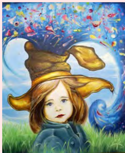
En el trigal Yudit Vidal Faife

Cada niño o niña tiene su historia, su historia previa y su historia de la adopción, por lo que es imposible que un cuento no personalizado pueda reflejar exacta y fielmente lo que ha vivido. Los niños no necesitan historias idénticas a la suya para poder identificarse con los personajes (pensemos por ejemplo en los cuentos de siempre que a todos nos sirvieron... ¿quién tenía una vida similar a la niña que vestida de rojo iba armada con un cesto repleto de dulces, bosque a través, para visitar a su abuela y se topaba con el lobo?, ¿a quién una madrastra le obligaba a limpiar la casa de arriba abajo en lugar de acudir a una fiesta de príncipes y princesas?). Todos estos cuentos clásicos, que esperemos que no se pierdan nunca, cumplen una función importante en el desarrollo y superación de conflictos y miedos infantiles aunque no haya niños o niñas que hayan vivido algo similar.