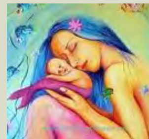
Avatares de MSPE