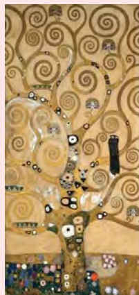
Árbol de la vida Gustav Klimt 1905-09

En las historias que las MSPE por fecundación sexual con “donante conocido” o por fecundación asistida relatan a sus hijos/as, aparece igualmente el amor como un componente fundamental de sus “orígenes”, aunque en estos casos no se trata del amor de los “padres biológicos”, sino de la generosidad de un “donante” que ayudó a la madre a cumplir su deseo de maternidad. Estas mujeres son conscientes de que sus proyectos monoparentales, esto es, sus “familias sin padre”, fueron elegidos por ellas, pero no por sus hijos/as, razón por la cual albergan ciertas dudas y sentimientos de culpabilidad a este respecto, y son conscientes de que pueden (/suelen) ser acusadas de “egoístas” por privarlos voluntariamente de un padre, y en el caso de la fecundación asistida, de la posibilidad misma de conocerlo algún día.