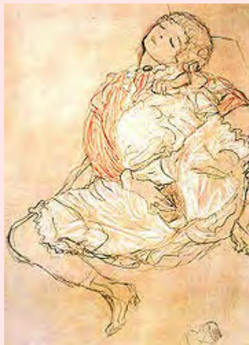
Mujer echada Gustav Klimt, 1916

Sus hijos/as, antes que nada, deben tener las cosas claras y asumir sin ambigüedades “que no tienen papá”. La explicación coherente de por qué no lo tienen proviene siempre, para las MSPE, de la narración sobre sus “orígenes”, aunque no siempre coincidan acerca de cuándo hay que hacerlo. Amparándose en lo que, en su opinión, recomiendan los ‘expertos’ (psiquiatras, psicólogos, pedagogos), algunas creen que hay que ir hablando cuando los niños/as pregunten o se den cuenta de la ausencia de figura paterna, pero que si no preguntan, es mejor no señalar esa ausencia porque podría significar inducirles la necesidad de tenerla. La mayor parte de las MSPE piensa, sin embargo, que los/as niños/as deben saber desde siempre que “no tienen papá”.