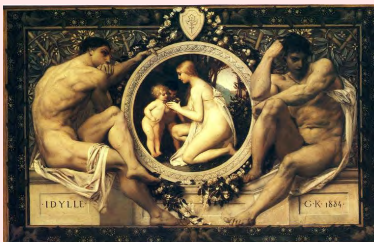
Idylle Gustav Klimt, 1884

Sea con estas narraciones sobre “los orígenes” o con las relaciones cotidianas entre madres e hijos/as, se busca hacerles conscientes de que no tienen padre, pero sobre todo de que lo vivan “con normalidad”. Para ello, les preparan para “desproblematizar” su ausencia apreciando las diferencias entre distintos roles paternos, que no tienen por qué coincidir en una misma persona, reconociendo el desempeño de algunos de esos roles por parte de otras personas de su entorno (parientes, amigos de la madre, etc.) que, en unos casos, hacen las veces de referentes masculinos y, en otros, contribuyen a proporcionarles una rica red social .