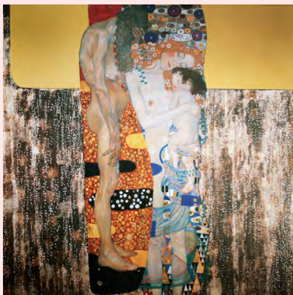
Las tres edades de la mujer Gustav Klimt, 1905

Lo mismo ocurre con el calificativo de madres “solas” que consideran inadecuado porque recalca la ausencia de la figura paterna, como si ésta fuera imprescindible para las tareas de crianza y educación de los hijos.