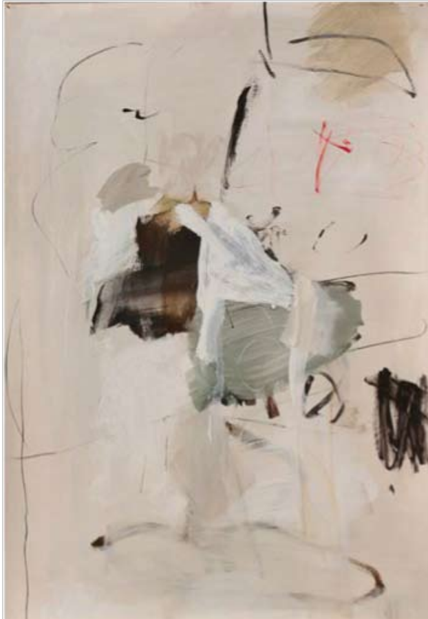
La chèvre, 2012

Cuando dos miembros de una familia biológica se reúnen siendo ya personas adultas, ambos son sexualmente maduros y el deseo de apegarse jun-