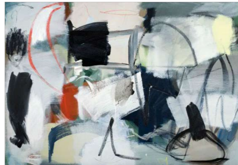
I latina, 2011

De acuerdo a algunos estudios conductistas, durante los años cruciales de su infancia, en los niños y niñas que crecen en estrecha proximidad unos con otros, se desarrolla una impronta sexual inversa o deseo de evitar las relaciones sexuales con sus progenitores/as y hermanos/as. La teoría llamada "Efecto Westermarck" funciona para suprimir el deseo sexual con el objetivo de evitar la endogamia. Las familias creadas a partir de la adopción también desarrollan el efecto Westermarck. Los abusadores deliberadamente confunden y manipulan a sus víctimas. El abuso infantil es depredador y revela una fuerte disfunción en la unidad familiar.